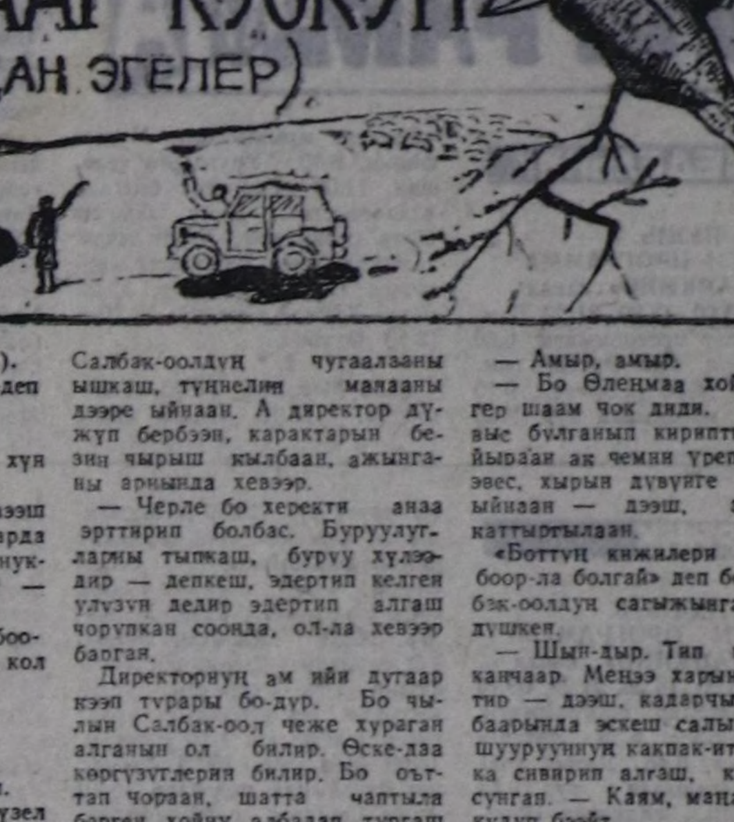
Салбак-оолдун чутуаалааны ышкыш, түнөйлөн манааны дээр мыйнаа.

Чердеп апкаш, кайы кире өөрүшүлүг болган ирги сен? Буудуң черге дөгөйиң турган боор.