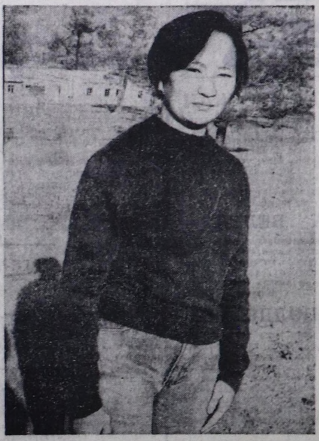
Окемчик ОНДАРНЫҢ тырттырган чуру.