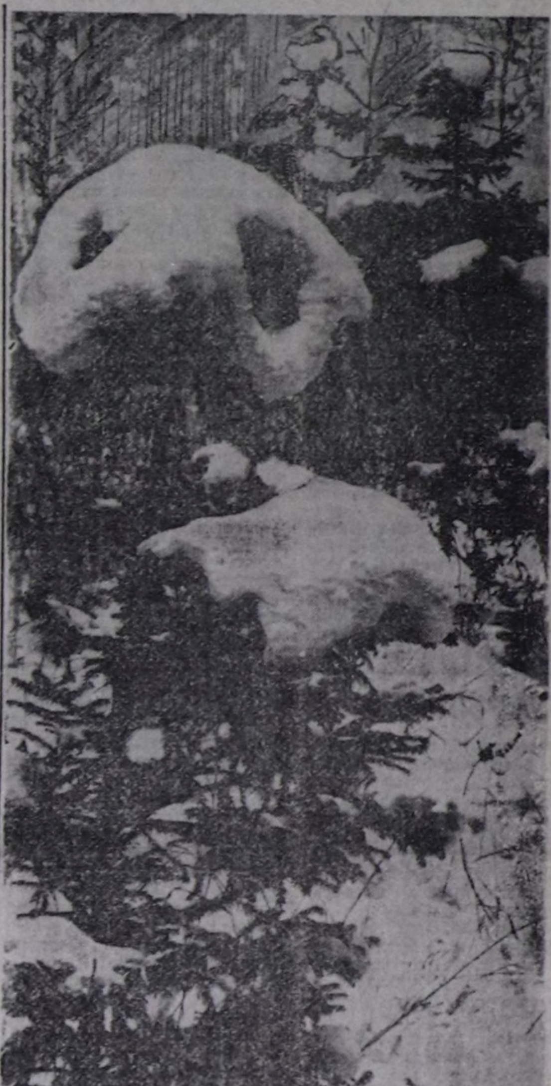
Кыштын силги аян-хөвү Кыял амырларда синген.