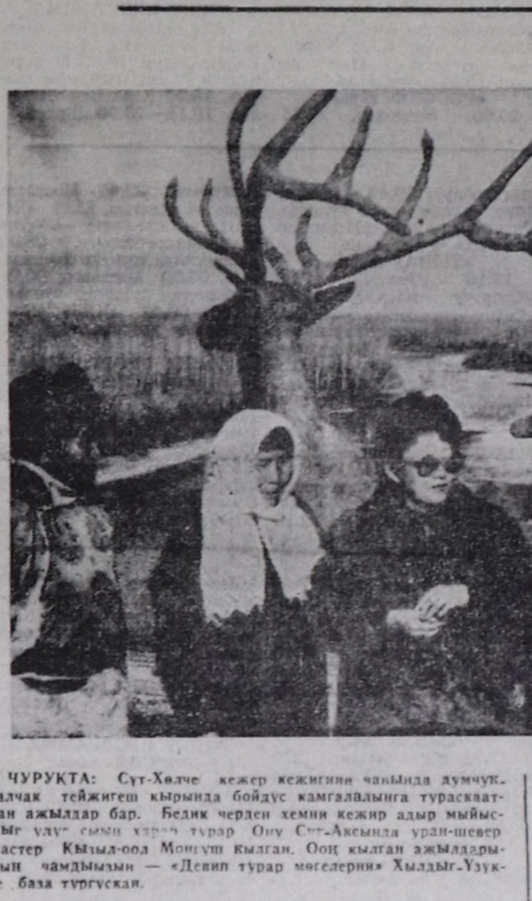
ЧУРУКТА: Сут-Хөлдө кежер кижини чарында думчук-талчак тейлеште кырында бойдук камгаалайына турсаактан ажылар бар...