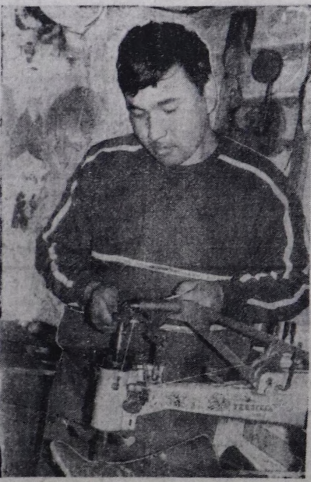
Охемчик ОНДАРНЫН тырттырган чургуу.