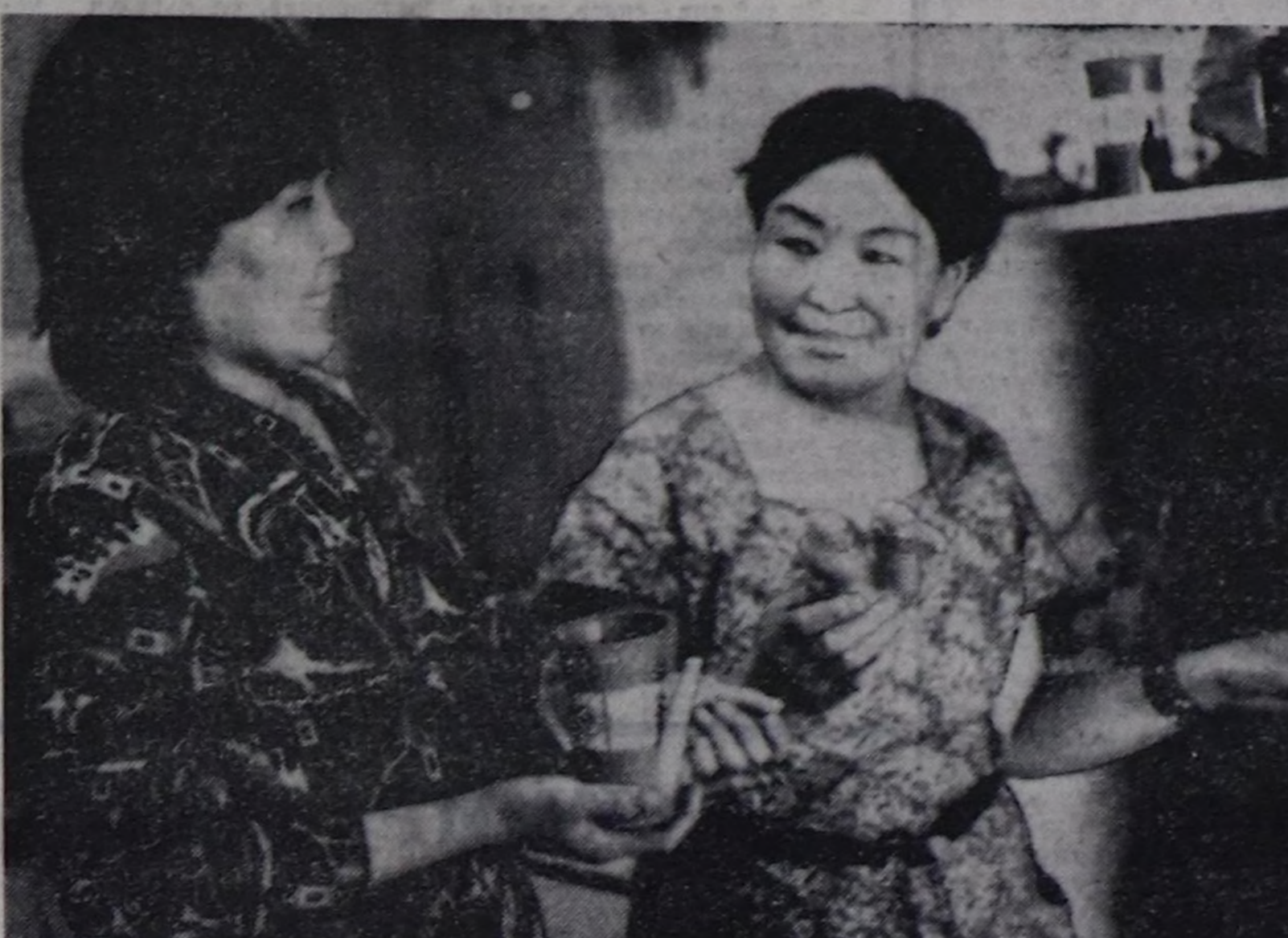
ЧУРУКТА: Улуг-Хем районда «Чааты» совхозтуң уруглар садыгында апаа оон чыл ажы үеде кижизидерин башкарып болуп ажилдап турарлар. Чодура суурнуң чурттакчыларының чаш ажы-тулун садыкче хемчегерин, хемчегерин, кижизидерине төлөтүп үзүп кирип турарлар. Охемчеге ОНДАРНЫҢ тирт-тырган чурру.