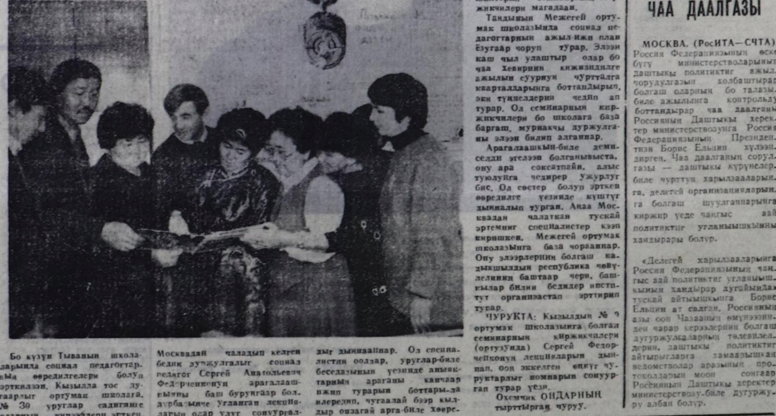
Бо күүлү Тыванын школа-дарында социал педагогтар-нын өөрөдөлгөсү болуу аргыларын ооруман шкколага, № 30 уругулар садгыне оларын кичээдери эртен.