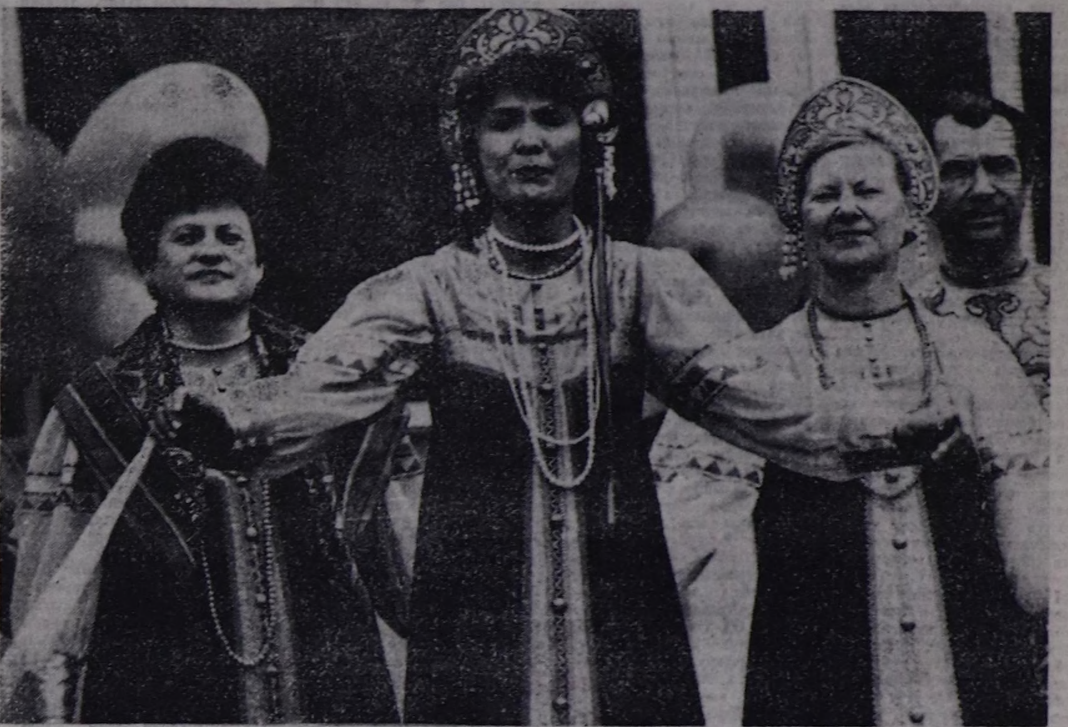
КЫЗЫЛЧЫЛАР МАЙ 1-НИҢ БАЙЫРЛАЛЫНЫҢ ҮЕЗИНДЕ.