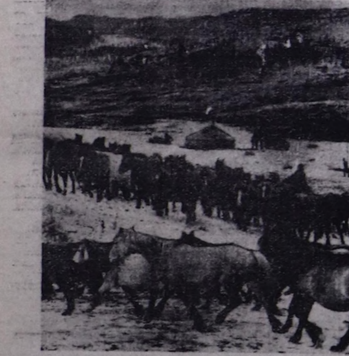
ЧУРУКТА: чылгычыларның кодында.

Тайылбыр: 1 — бригадирның фамилиязы, 2 — ажыл-агый, 3 — 1991 чылда төрүүр 100 сарлыктан алган бызааны.