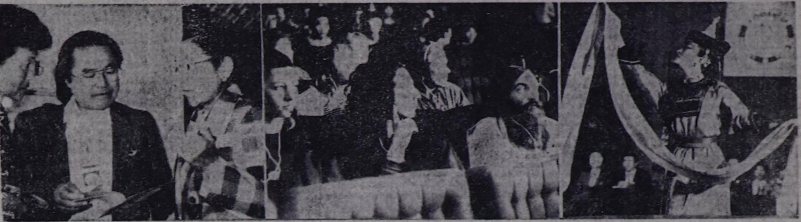
Делегейни бирги хөгжүм-шиччел «Хөмөй» симпозиуму Тыва Республиканың төвү Кызыл хоорайга дүйү ажыттыган.

Оод киржикчилери хөгжүм-шиччел театрынын залында оодуттары эзелкек соода, «Тыва» ансамблдин сымт-хөмөй симпозиумун киржикчилерини мурунга сес ап, чүве чугаалаан (оон сөзүлгө солунунун бо номеринде парлаан).