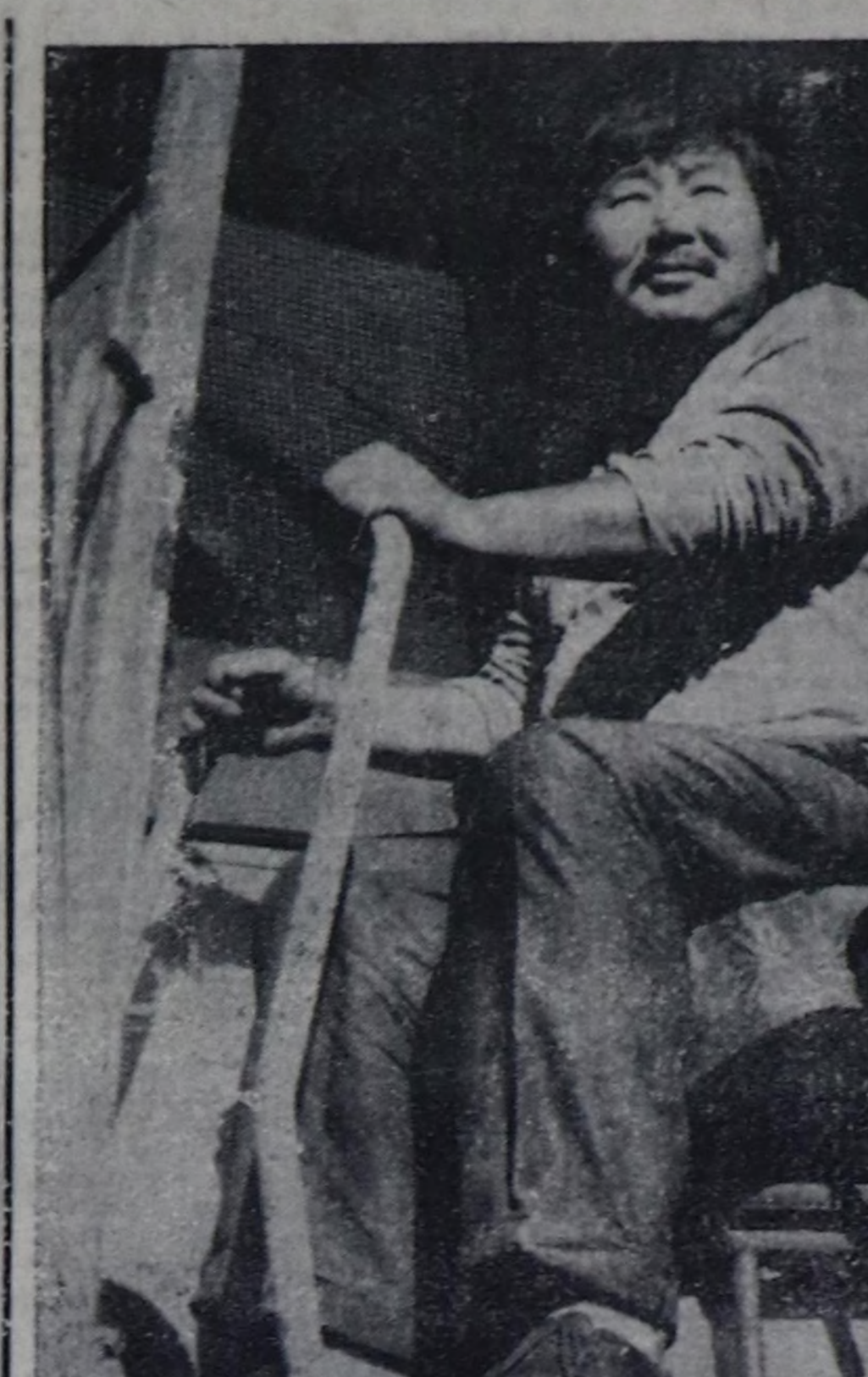
Наадымга уткуштур УЛАМ-НА ЭВЭЭЖЭЭН

2. Тыва Республиканын Кө-дөз ажал-агыл министрство-ну 1992 чылда малчынар тур-лагарына социал-амдырал туудаларын кылгыры болгаш электржи-дөзүн камсыр-ла-га дүүштүр хандыар. 3. Тыва Республиканын Кө-дөз ажал-агыл министрство-ву, чер-чер чагырганын дар-галары, Россельхозбанкның Тыва девицээр банкының районнар салбырлары, колхоз-тары болгаш совхозтарының ууртукуларынын иштинин мал-чы калары турар ажилдак-чыларга ажил телвирин бири-ги эчөөдө бээрн 10 хонук хуусада хандыар. 4. Тыва Республиканын Ка-дык камгалал министрствоу мал коданарына бирин мал-чыларга эки дуудалганын көргүсүн, оларын ам айла-биле хандырын боттандыр-гар. Тыва Республиканын Сан министрствоу, Кадык камга-лал министрствоунга көрүдү-гө дуудалганы хевирин ашка-хөргөдөгери кезин үстүлө сорулганы ажилдакчы кыл-дыр чер-чер чагырганын даргаларынын эргезиле тус-кайлап бээр. а олар Тыва Республиканын Кадык камга-лал министрствоу-биле ке-рөөлдер бугаар ук ашка-хөргө-дө биле малчыларын ханды-дыар. 5. Амдырал хандырыл-ганын девицээр бугурулгө