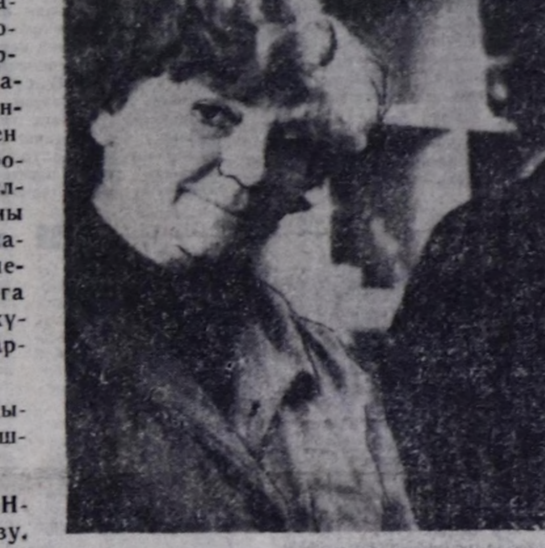
Оларнын ажы-лынга хожудааш-кыннар турбаан.