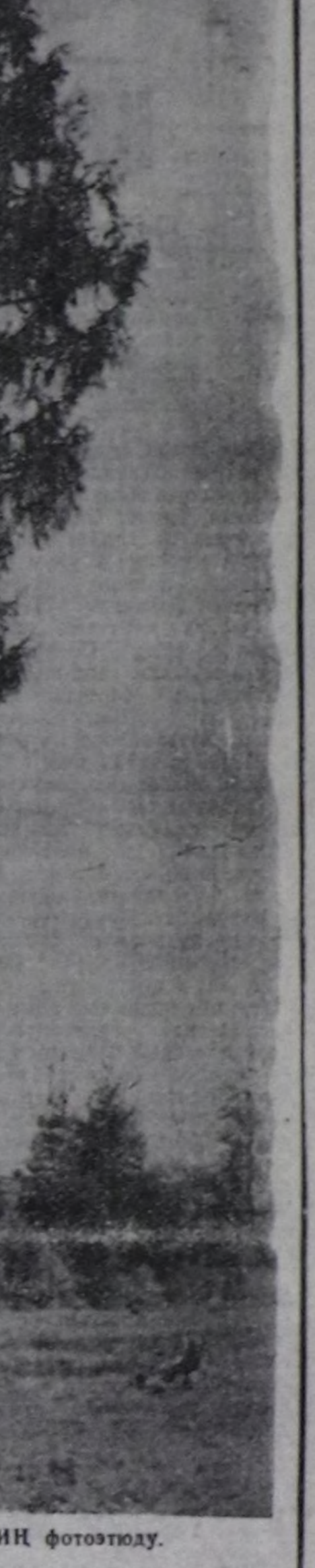
Онлар ОХЕМЧИКТИН ФОТОАЛБУМУ.

— Хөндүрүл-ле келжизе, менээ чүүп-даа херээ чөк. Акупунктура дээрге чүу дээ-нин ол?