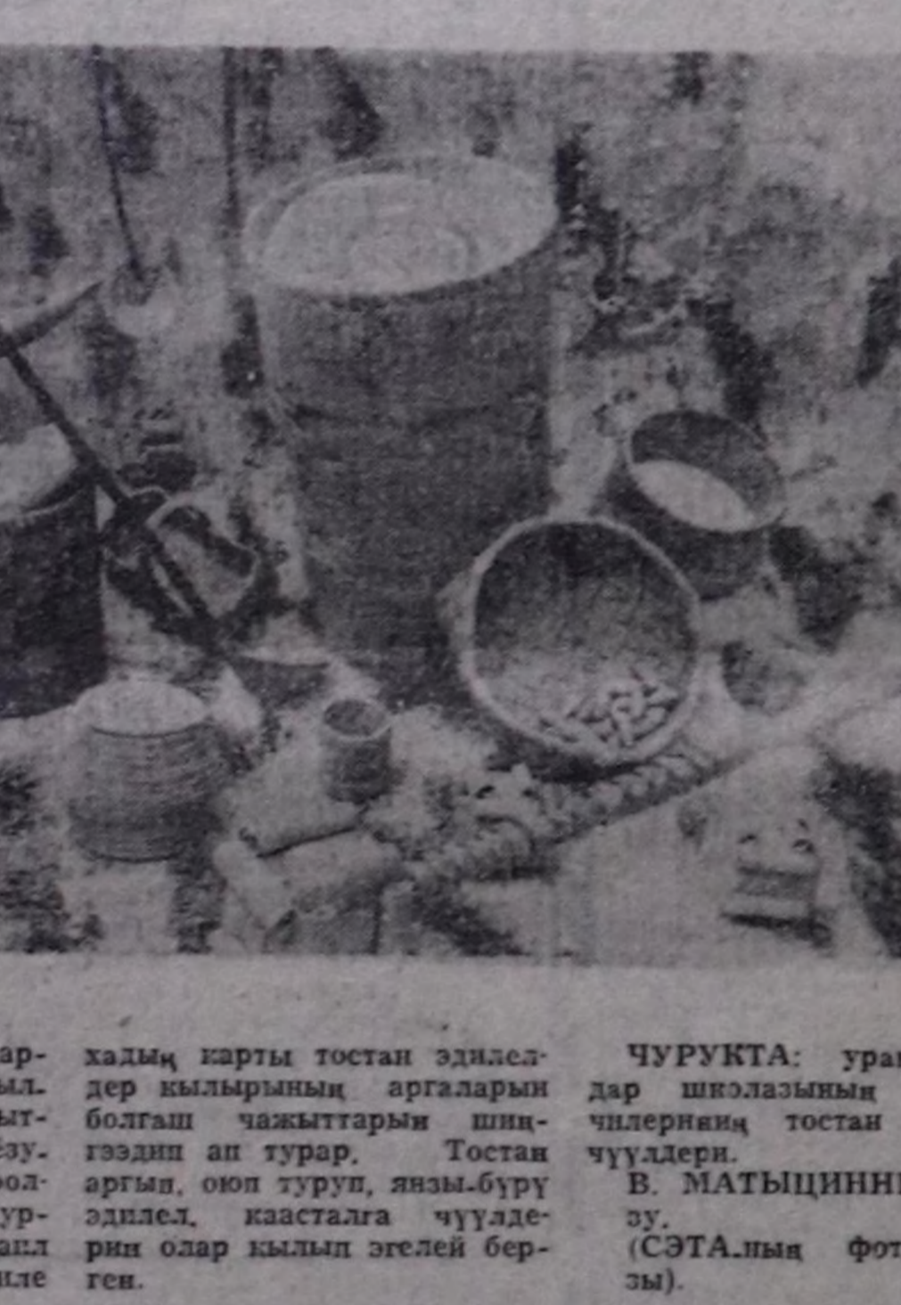
ЧУРУКТА: уран амылдар шкколазының өөреникчилериниң тостан кылган чүдүлери.