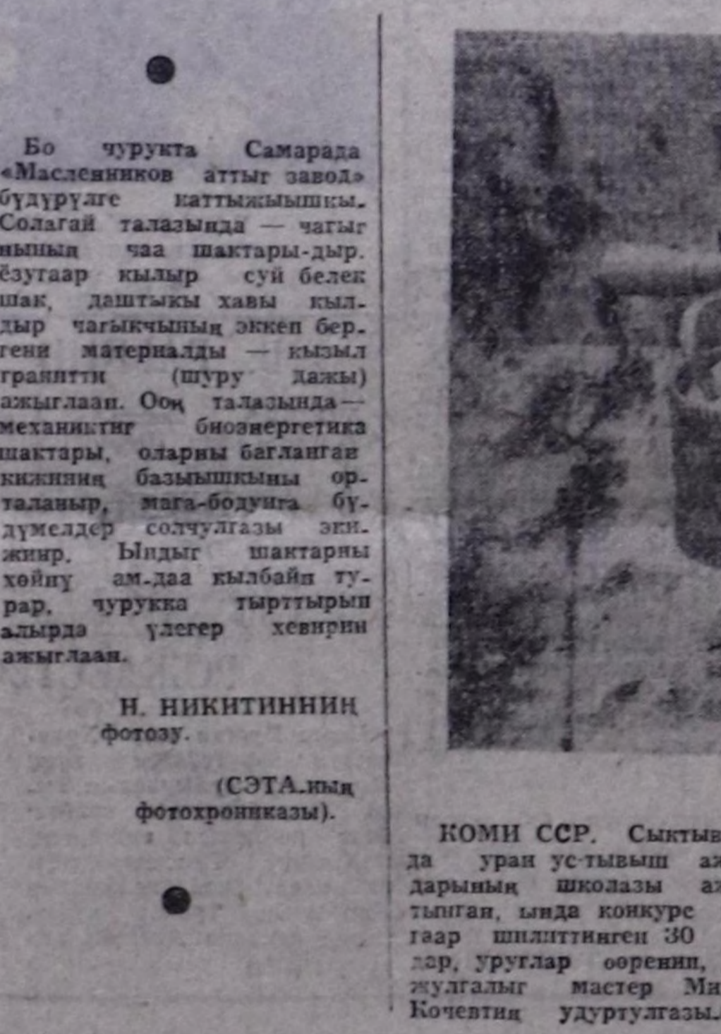
КОМИ ССР. Сымтыкварда уран устымыш амылдарың школазы аягыттылган...