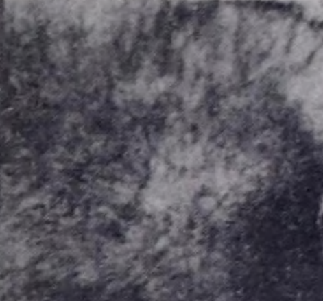
Респотбессоэтун Кызыл... Лениннин мааниси ошол м...