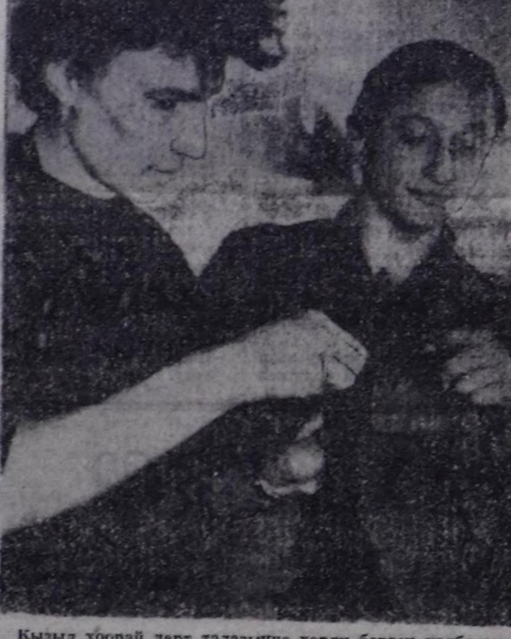
Кызыл хобрай дөрт талазыгче херли берген калбары өршенин-ле аякка-агы даштыг чорур. Оларнык чамдыкмын өзүлөгө аажыткан хосталган, кел чорур. Чамдыктары салгырже далаажар.

СУТ-ХӨЛ. Карл Маркс ат-тык совхозтун сут-баран фермазында улуг инек ка-назы аякка-агы кирген. Ол комплекске саанчылар-нын бугуручулуг аякка-агы-нында, индиктер аажарын, чегеренинге таарымчалыг байдил тургустунан. Малды сугатарын, эден ашта-арын механизастаан. Канжа-рын чылдар, өржек чүгү-ла сут-биле хандырап кү-рүк котельняны туткан. (Бистин корр.).