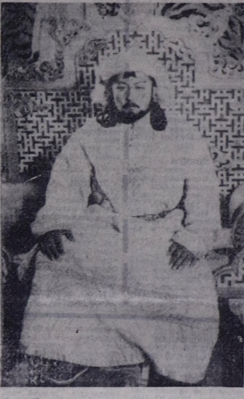
Сураглыг чогаалчы Чингиз Айтматовтун «Чингис-Хааннын ак булдуу» деп шийини республиканын хөгжүм-шин театрынын артистери чокта чаа керүүсөлү...