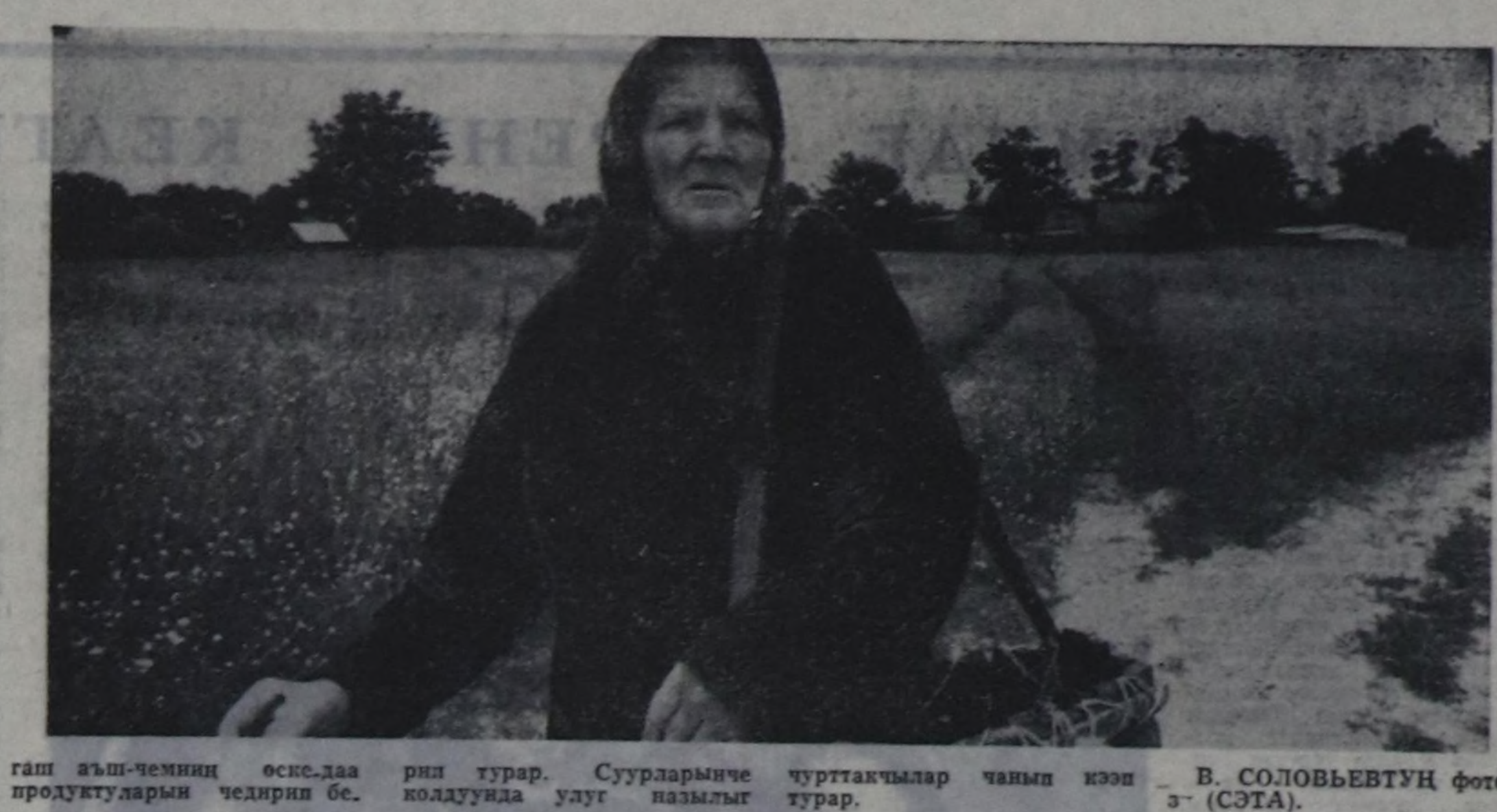
рип турар. Суурларынче колдууда улуг намыздыг чурттакчылар чынып кээп турар.

ЧУРУКТА: боттарын суурларын мооң муруну, да көжүр чоруткан чурт- такчылар дедир кээп турар апарган. Оларга хабети бол- гаш аш-чемниң өскө-даа продуктуларын чедирин бе-