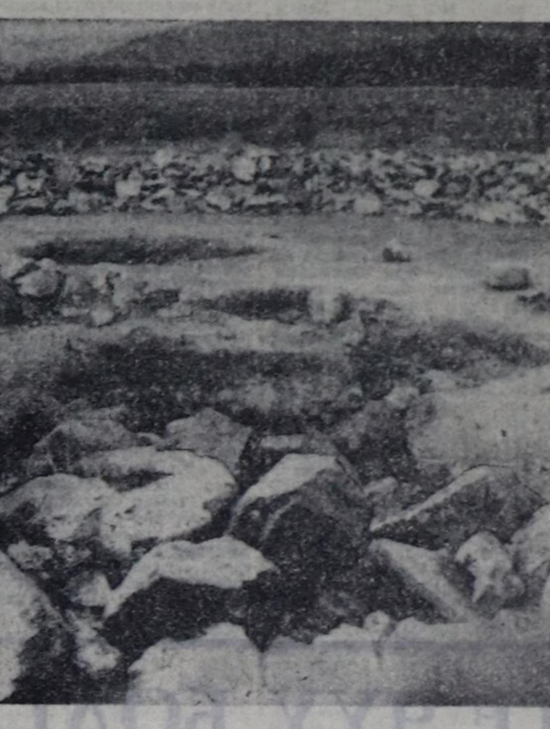
У-ваа, солунун аа! Уш көшкеш...

дөш бодадым. Кудургай чүш чыл бурун... «Амшаан» бичирден чып турган мен? — дидир.