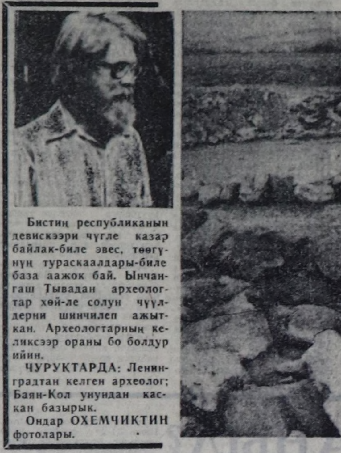
Бистин республиканын давискээри чүгө кезер байлак-биле эвес, кезерин тураскаалдары-биле...

Кудургай. Ол дээрте, дөш черден куду бадарга дөвүнүк чер-дир... Кудургай деп сөстү утнаам-ла кой.