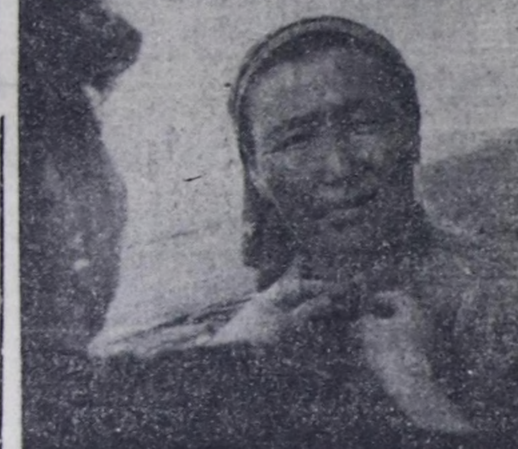
ЧУРУКТАРДА: Кызыл районда Ак-Оол Ооржак, Олар Чедер холдуң кылдында делген олардыкы черде чайлаан. Кадарган хойларын олар чайгы хүниерле эки семиртин алдырычте улуг кичээнгейни салып турарлар.

Эртен кижын малчынар кымамак ажыдалаң. Чүс болжа онааштыр 111 баш хураганы менди доруктуур алка. Хураганын өзе бөөрге, оная-менди аныглааш, дужаапкан. Дук кыргыт алдырыга чедиишкын бар болган. Бир башка онааштыр үш килограммы кыргынын ажыр күөсеткенер.