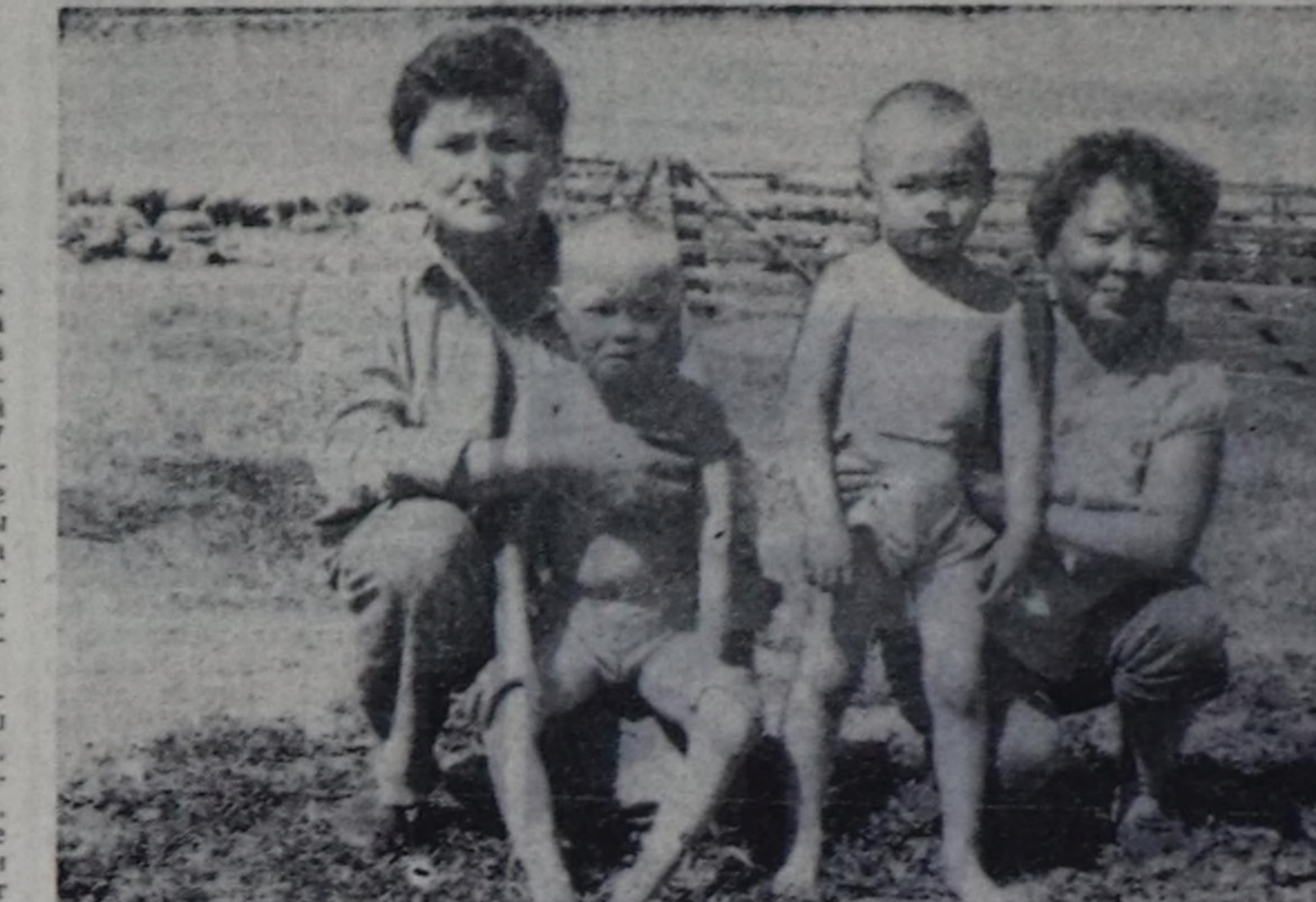
Хадмыралаа караан чаам. Юранның дурюязын ачаам Сеиден Хемчикке сураганаан эзер чазар шевир кижилерниң бирөөнү турган.