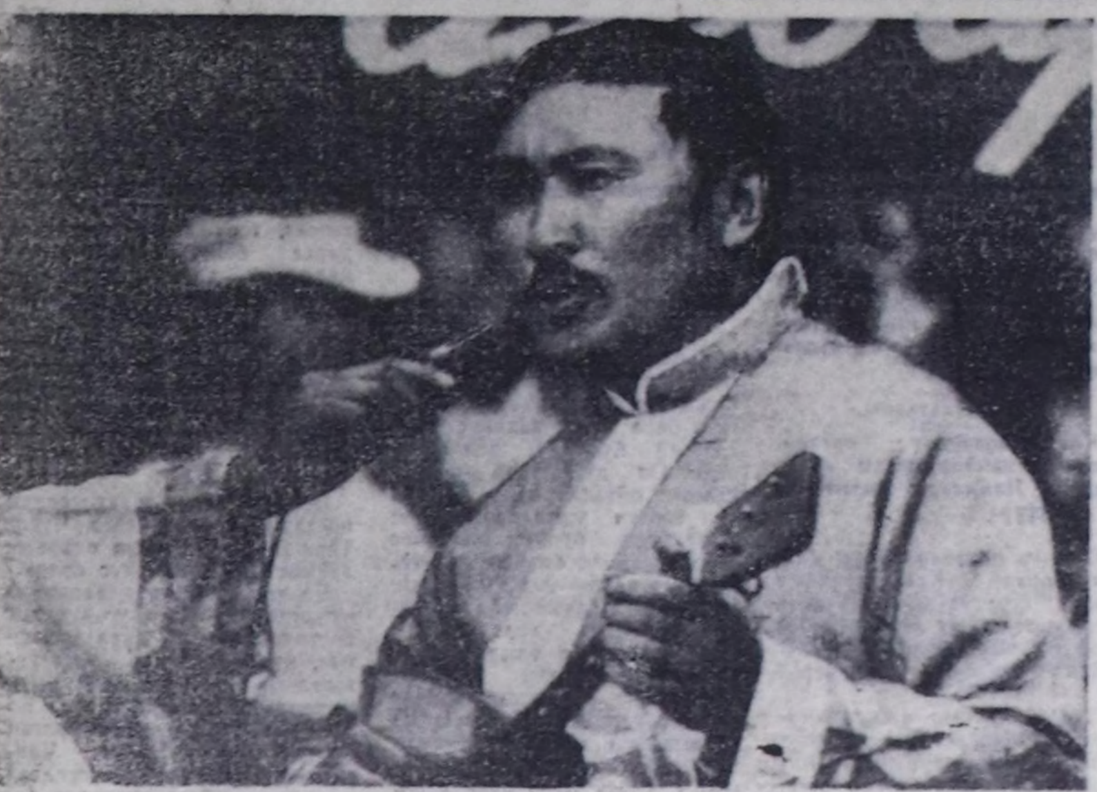
Сыгы биле хөмөйм чаржалаштыр Сырмынадыр салып берейн. Диналар даа... Ондар ОХЕМЧИКТИН фотозуу.

минге херек бүгү-де чүгүлөн барык шүтү, бар. Оңу бир оңагай шымары болза аажок дүрген-сичичел. Хымисте ап бистин Совет Эвилдинде берин кураткан сүндүн-база ыдым турар. Ол аргам көзаа ажыл-алай этоменин доктору И. Сайгын ажыткаш. Амгы үеде бе- нин кураткан сүтүн чүге Башкырия хымис аар-ла- ама турар. Ол чорук коңчүг ажыттыган. Оң кол-ла эксондана Эйфельдин суура- ны. Ол дээрле эемир өктин- деңиз. Ол амгы үеде чедир Парожтин төүндө туруп ту- ра, француз хымисаладым зи-не кол көрүштүг черлери- нин бирээ.