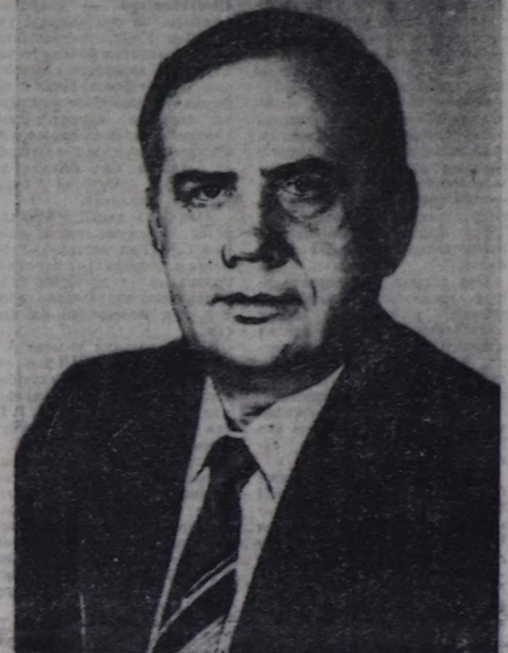
1932 чылда «Полтава» коорайыга төрүттүгөн, украин.

«Допчу намдарлар» Владимир Антонович ИВАШКО