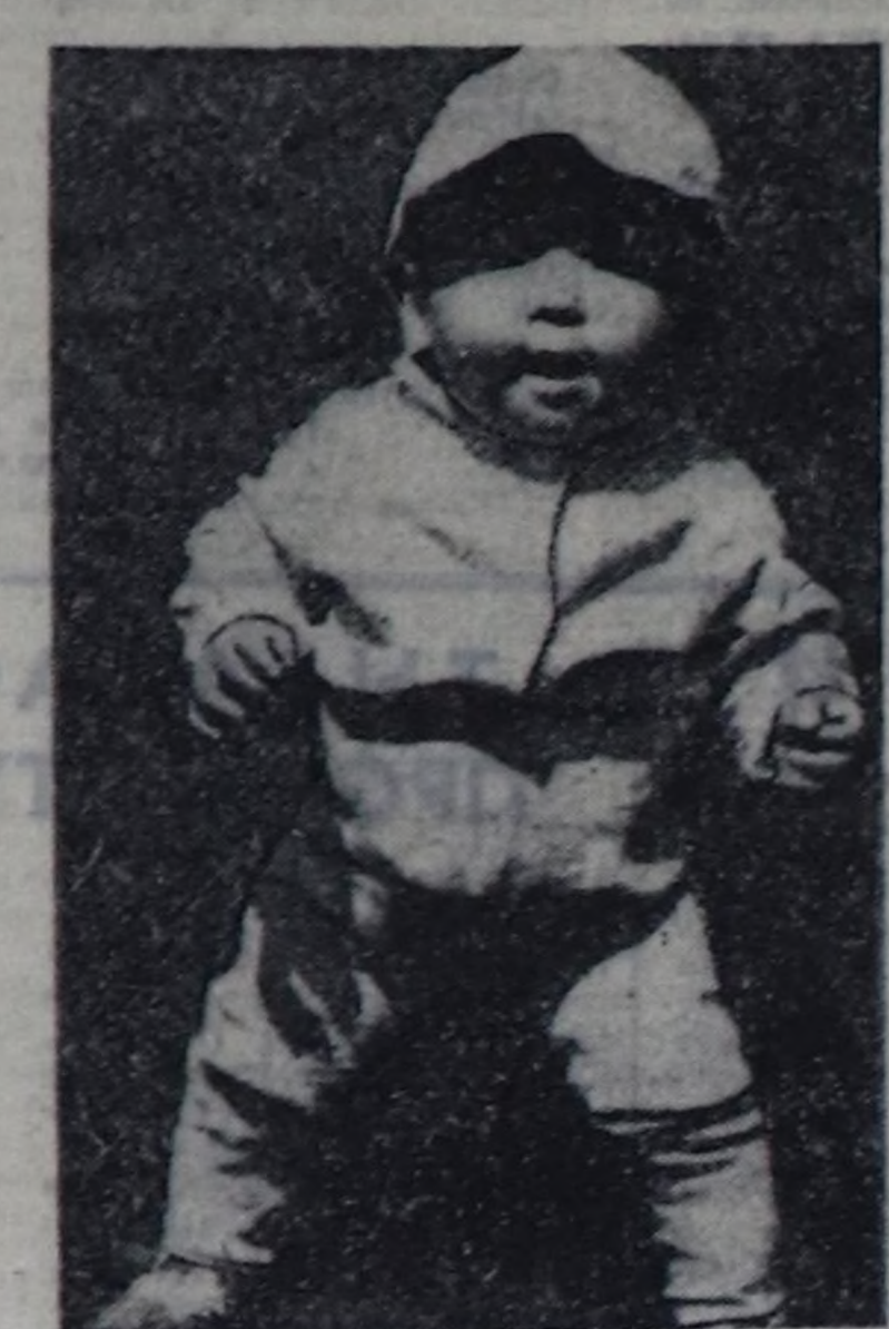
Хензе топка ийн бутка Хензе талкы түрүзүткү. Ол ам черле кээп дүшпөс, Оран-чуртту эргий базар.