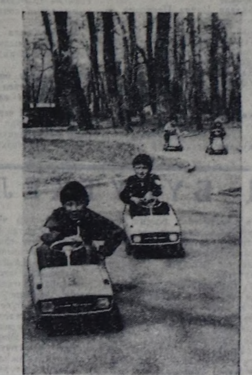
Парка хостуг шөлге Барык ойнааң, атуу-дүтү. Эрттериңи сүрүп четкең, Эрттер халайың, дүтү-ауу.

Муса ДЖАЛИЛЬ, Совет Эмгекчилерин Маалым, татар шүлкүчү.