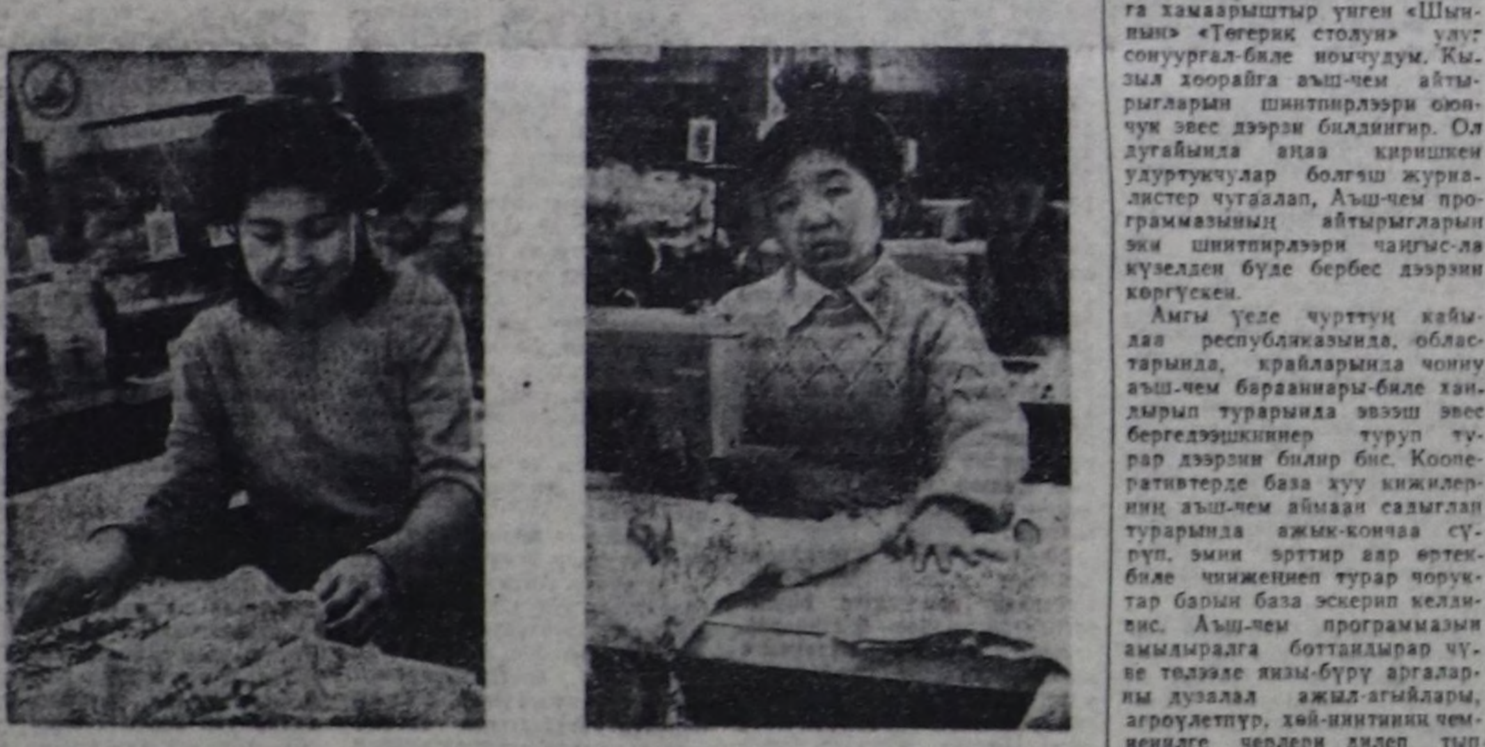
Кышындын даарымыга фабриказының Бай-Тагга районда финалдың коллективте чагырдылар — Май 1-ге утуунуруп күш-ажымны чон көртүрдүрүп, төлөткү ужуражып дээр бо хүнерде багай өвөс ажылдап турар.