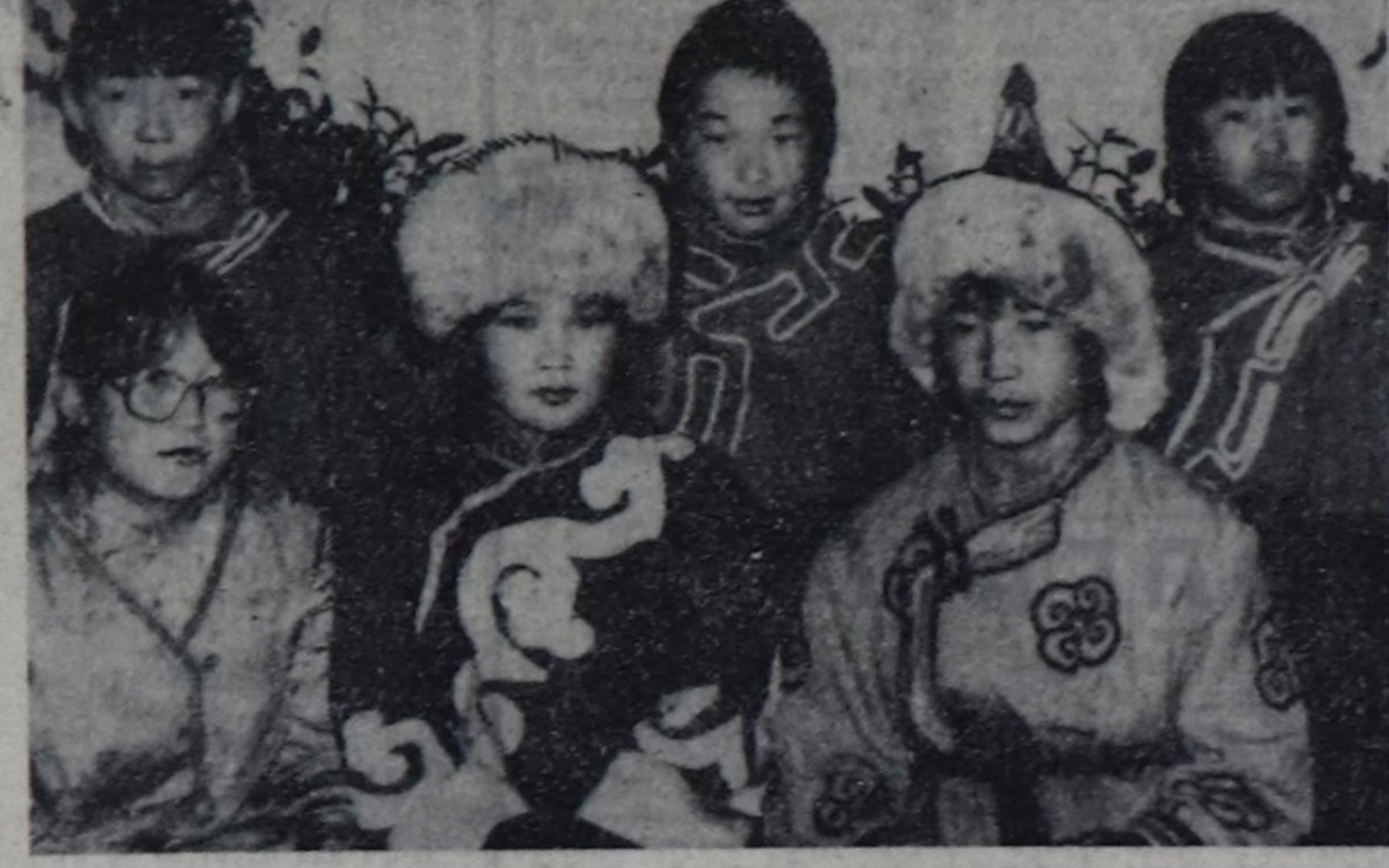
Чонун күжү-биле туткан