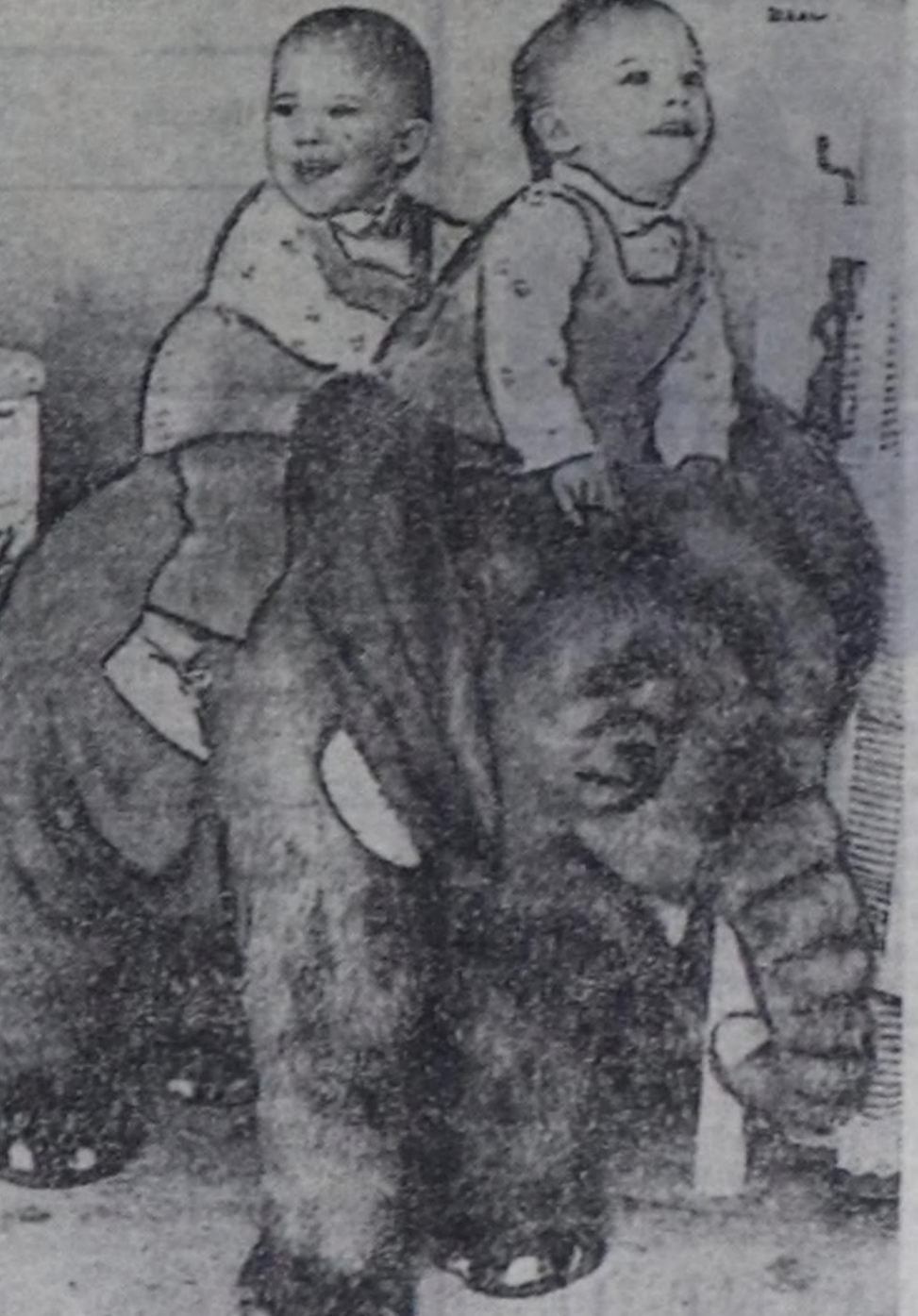
Ийнс Никерсон алышкылар 11 айлымда-ла Америка-да эң суралгыч телесмдыктар шынаан апарганнар... Теледамчылыктагы бичир уругуларын ажыгаларының үеңи кызыгарлаан-даа болза, бо алышкылар доктаат... калындаан ийн натап хай үе иштинде теледизинеге «ажыдаачылар». Оларның киришкен дамчыдылганы ды-ка солун болган.