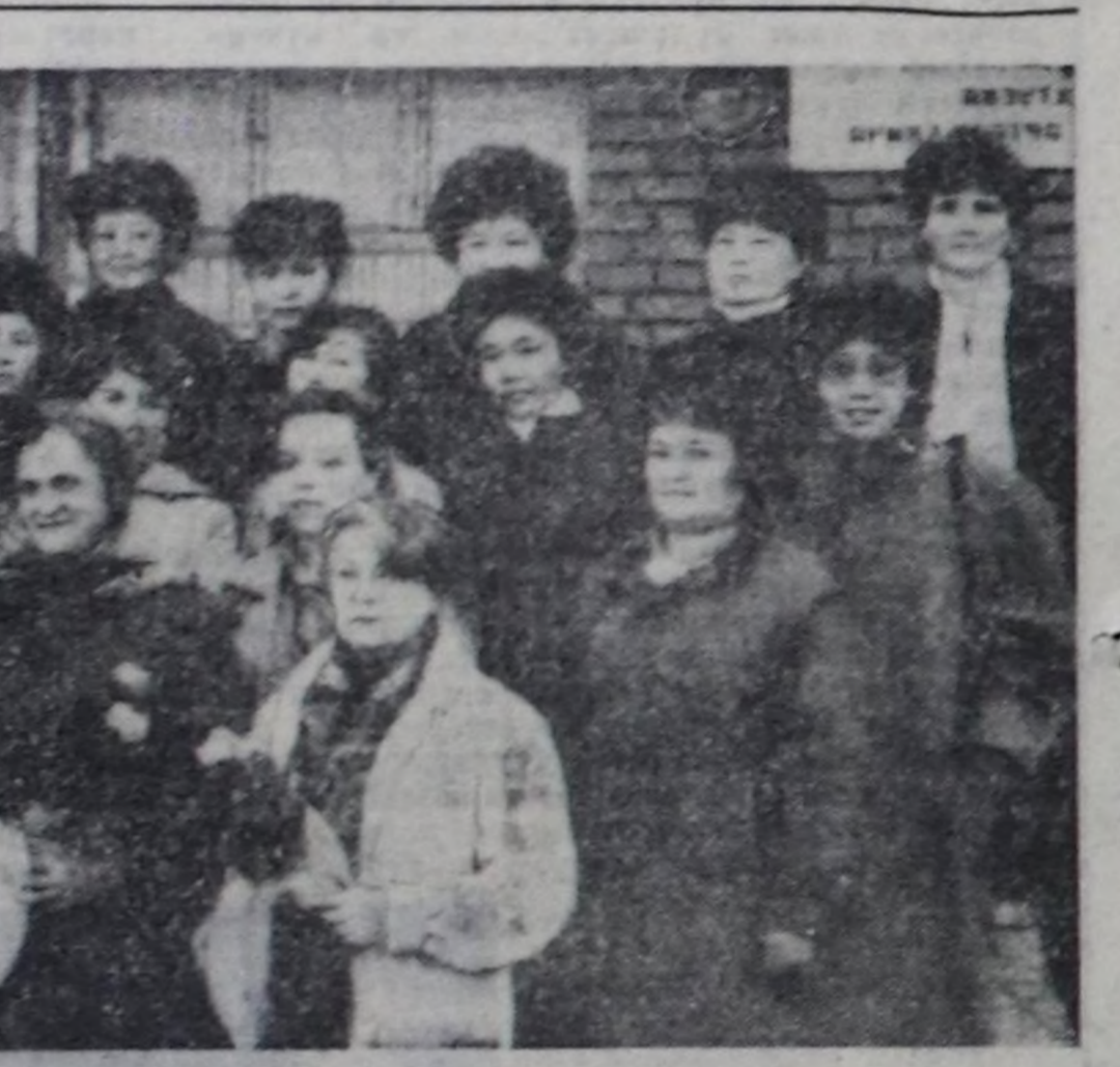
Фини залчылар бөлүк башкылар-биле.