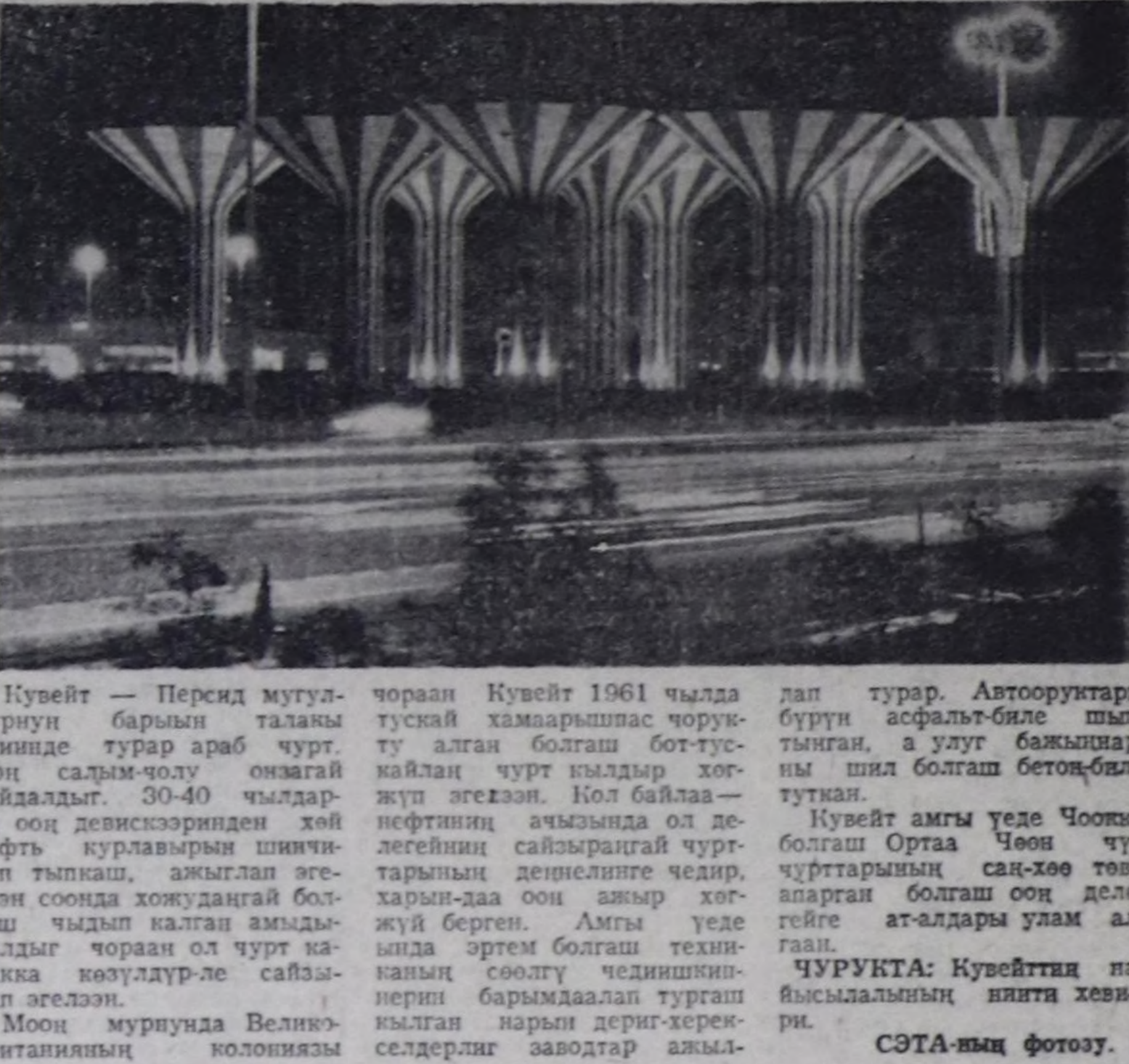
Кувейт — Персид мугал-дурун барыш талазы эринде турар араб чурт. Оон салды-воту онзагай байдалдык. 30-40 чылдар да оң чевиринден хой нефть курлавырын шычыл-көп тыпкан, аял-агыя бол-лоон сонда хождунгай бө-гөш чыдып калган амыды-ралдыг чоран ол чурт кар-ракка көздүр-ле сайзы-рап эгелээн.