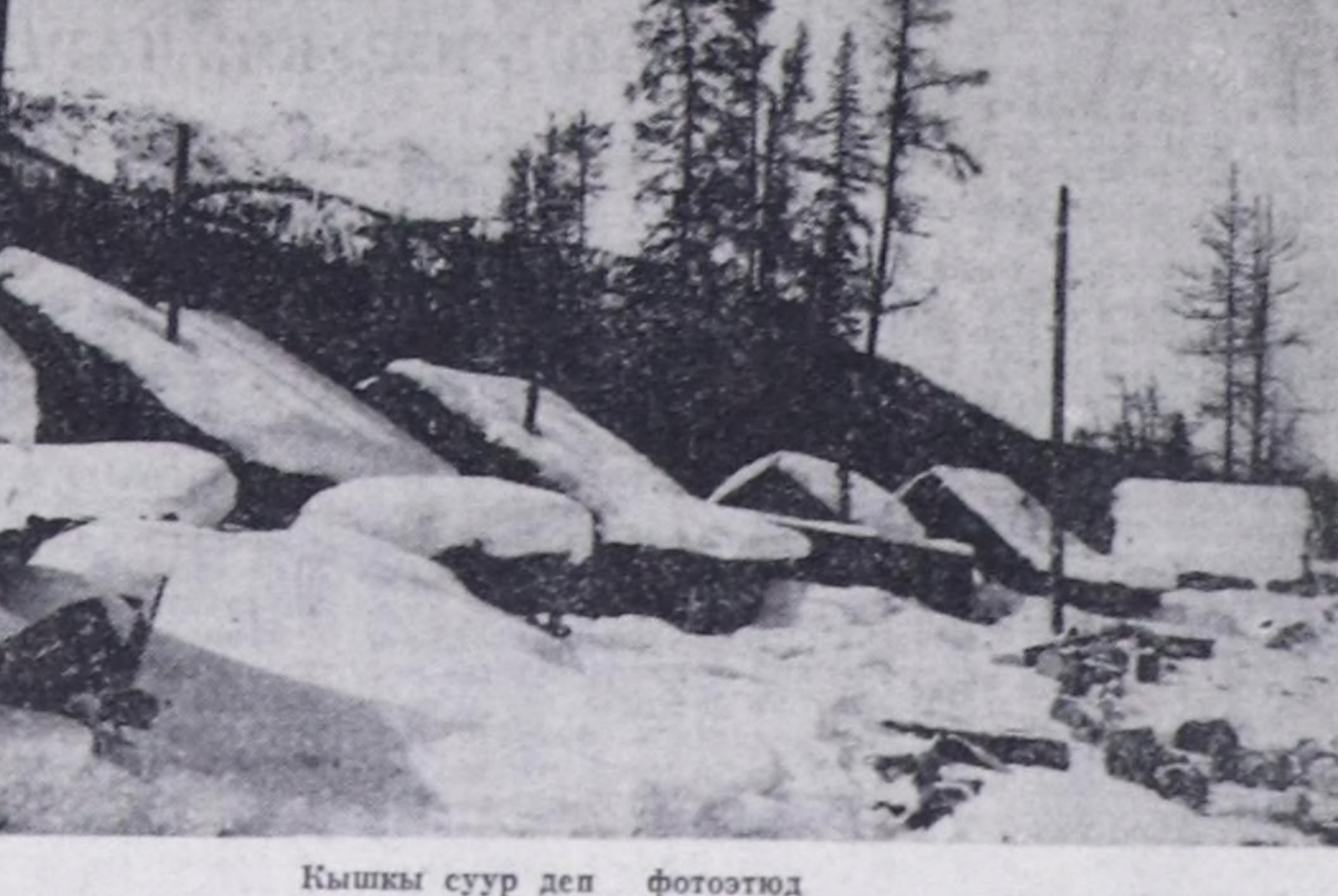
Кышкы суур деп фотоотуд

«Тыва даг-дүгү» комбинаттын удуртукчулары Ак-Довур хохорайнын хой саң-талы чурттакталынын саң-талын барымдаалап, ону өөрчүнн көргөш, хохорайнын экологтуг байдалын эжик-тер, ону яны-буру ыштан, газтан, довурак-доозундан