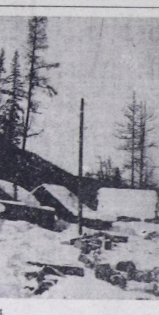
Кышкы суур деп фотоотуд

«Тыва даг-дүгү» комбинаттын удуртукчулары Ак-Довур хохорайнын хой саң-талы чурттакталынын саң-талын барымдаалап, ону өөрчүнн көргөш, хохорайнын экологтуг байдалын эжик-тер, ону яны-буру ыштан, газтан, довурак-доозундан