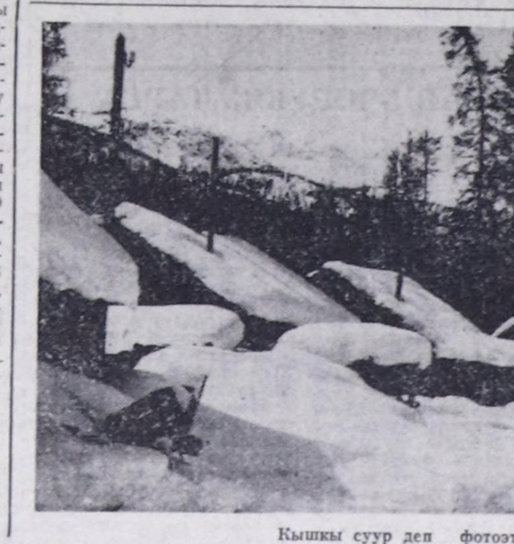
Кышкы суур деп фотоотуд

Алдан-сезен чылдар аразында ажок өскөн сынын-мыйгак сөбүтүг беш-алды чылдардан бээр көзүлүр-ле