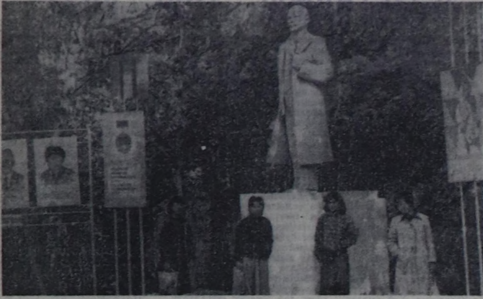
Культураның болгаш дыштанылганың Гастелло аттыг парьында.