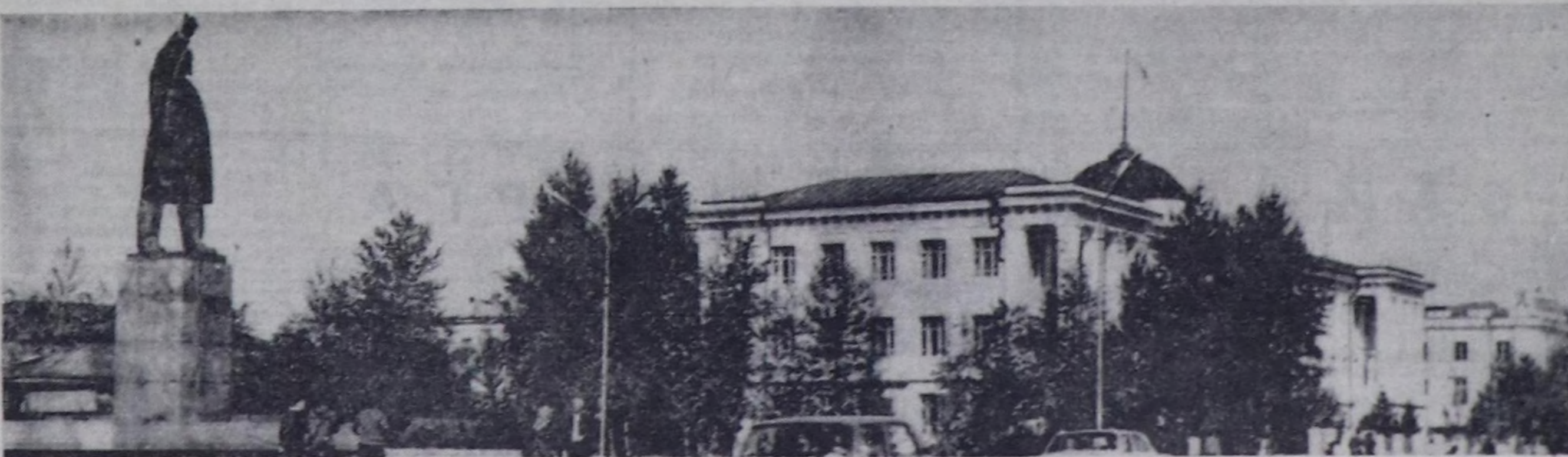
РЕСПУБЛИКА НАЙЫСЫЛАЛЫ КЫЗЫЛ ХООРАЙ. ЛЕНИН ШӨЛҮ.

Бүгү улустуң уугу байырламы—Май Бирин «Нөдөз элек-три тууду» эргелелиниң монтакытери күш-ажылчы че-дишинерлиг уткуп алганнар. Байырлап мурунуң чары-мының тилекчи И. Н. Перепягинге удурткан бригада бол-ган. Ургүлчү-ле хову, шөлге амылдар берге байдалар турза-да, ол коллектив ай планнарын ургүлчү ажыр күөсөдир нел-ген. Бригада бедик вольтуугу 15 километр хемчээлдиг элек-три шугуунуң бир участкан чоокта чаа ажылдала кириген. Улуг-Хем районның «Ак-Туруг» совхозунда дөрт хойжу бри-гада төвүндө электри чырын кириген. Амылды көчүг эки шынарлыг кылдынган деп хулап алган.