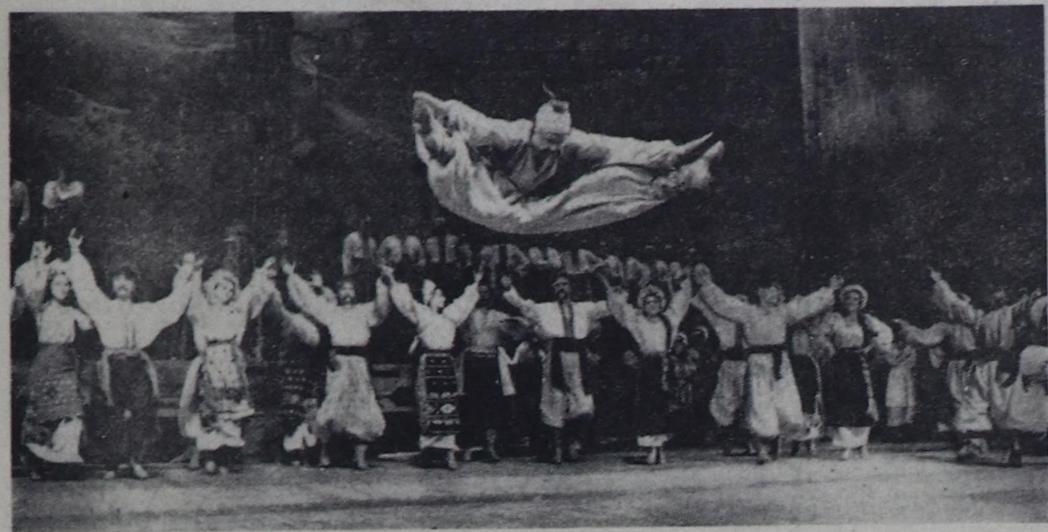
Украин улустун Г. Верева аттыг хорунун уран чуулун совет болгаш даштыкы көрүкчүлөр эки билдир. Украин композитор болгаш дирижер Григорий Веревакын 1943 чылда тургусканы бо коллектив украин фольклорунун, улусчу чогаалдыгынын непередикчиси болган.