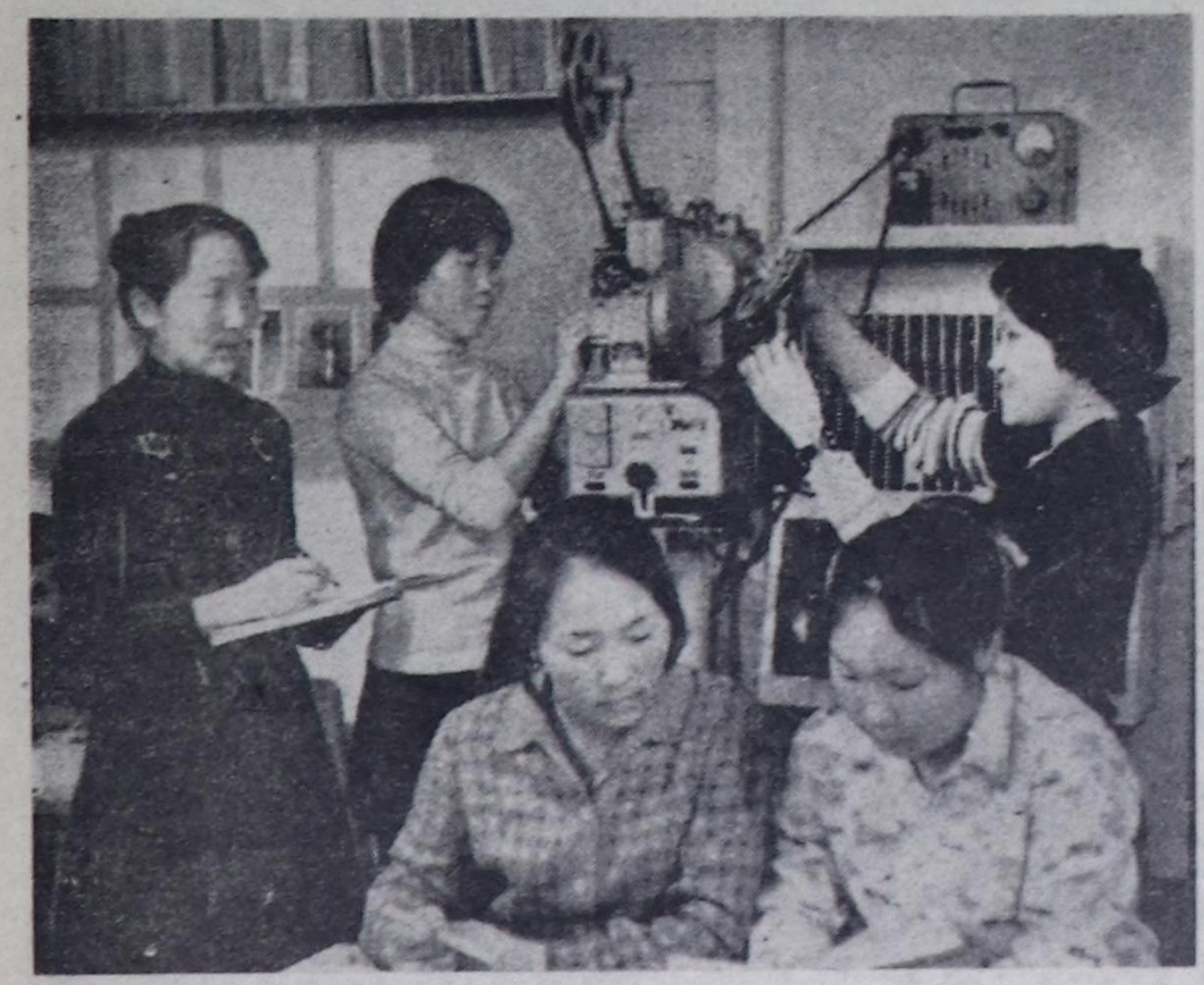
Келир үенин башкылары—Кызылдың башкы училищезинин балук сургуулары практиктиг ичээл үезинде.

Партия, совет, хой-ини болган аныктыгынын органдары школа айтырмын кичөөстейини улустарын, улус аныктыгынын чегерелешир турар дээртенге кыдыр өөрүрү. Ыгындай Бий-Хем районда бо талаам-биле сөөлү үдө чамдык аныктыгы чурдугуна. Тогу районда ийги көрүдүрген база элек бестел. Он мичаш эрткен чылдым Бай-Тайга район школаларын болган уругтар албан чегерелешир бестелеринин талаам-биле социалыстти чарыштын тилеги болган билдир бис. Школа аныктыгынын айтырмын партияны айтырмын деп чүвени ханымы-биле бибилеан, бисте дуз-деткимче моон сонгаар-даа улус боттот ботурунга идеген турар бис.