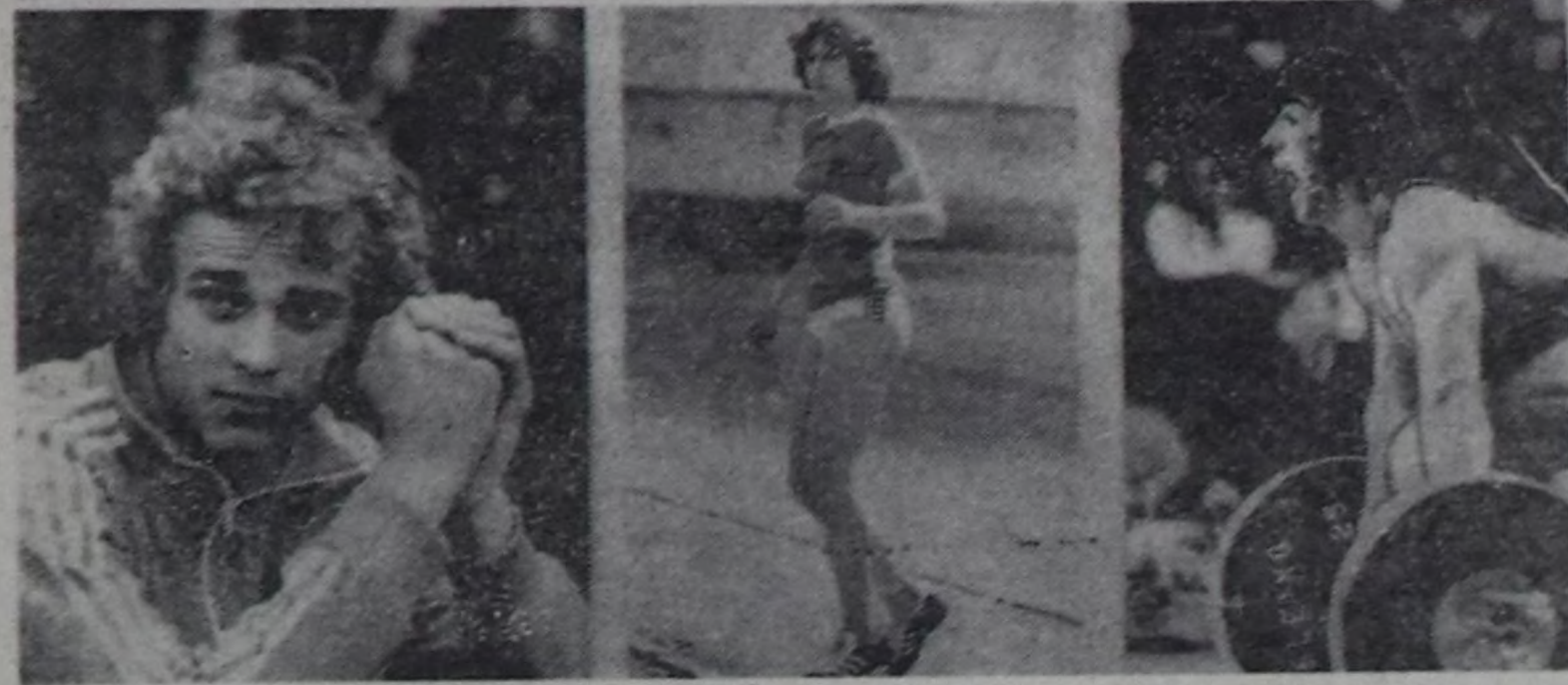
ССРЭ-нің спорт парлагының федерациясы чаңчыл апарганын ёзуугаар 1978 чылдың эң эни спортчуларын адан. он кижи бо: (устунае одуруга солгай талазыдан) Николай Андрианов (гимнастика), Майя Чибурданидзе (шыдыраа), адаанда одуруга: Владимир Ищенко (чик атлетика), Вильгельмина Бардаусисене (чик атлетика) болгаш Юрий Варданян (аар атлетика).