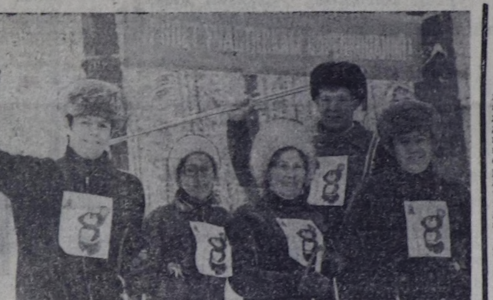
Челябинскиниң трактор эведоун ажалчылары болгаш албан-хаакчылары дыштаныр хүн сангында-ла заводтун спартакнадына киржип турарлар. Субботада болган воскресеныеде массалыг ээлтчек-лиг хаак маргылдаалары, ГТО нормаларын дужаары болур.

Хевириня өрөдиге черин — кулытура институттарын ажалдырып негелен. Олар «Дубтар» ажалдар уран чүдү, театр, музыка таланы-биле мергежиди кижилерни белеткен турар. Өрөдиге доостурга хөгжүм херекселеринге ойнакчыларыны филармонияларың 256, эстрадиниң 450 коллективтеринде манай турар, операның 42, комедианың 29 театраларыны, симфонияны 44, камердыг музыканы 66 оркестраларың, 45 капеллаарже, мырмын болгаш танцыны 68 ансамбльдеринче, улустун хөгжүм херекселериниң 26 оркестраларыңе конкур эртекте кирип ал болур. Шин театраларыны 500 оркестраларының брасаныңе ажалдар бижикти берип болур... (Устунде адаанымыс чүдө профессионал коллективтер-ли).