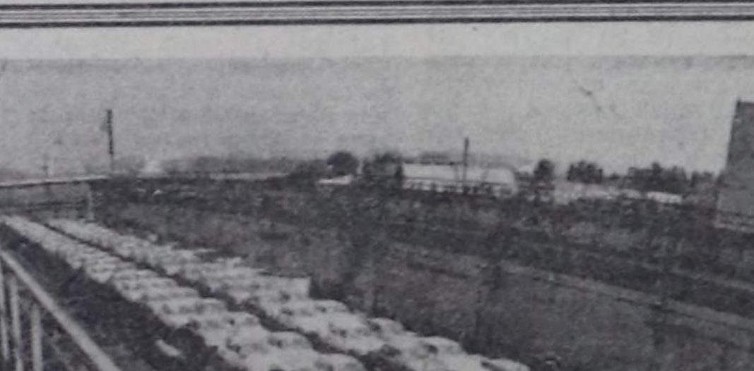
Укран ССР. Запорожский «Коммунар» автозаводуң коллективин эрткен чылды чедиршиңниң дооскан.

жеш» деп автомобильдерин будурген. ЧУРУКТА: «Запорожец» автомобильдер заводтун херимини иштиңиң.