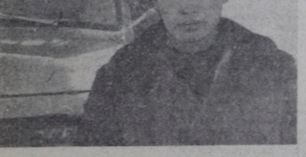
Чурукта: мурнакчы Ч. М. Фотозу