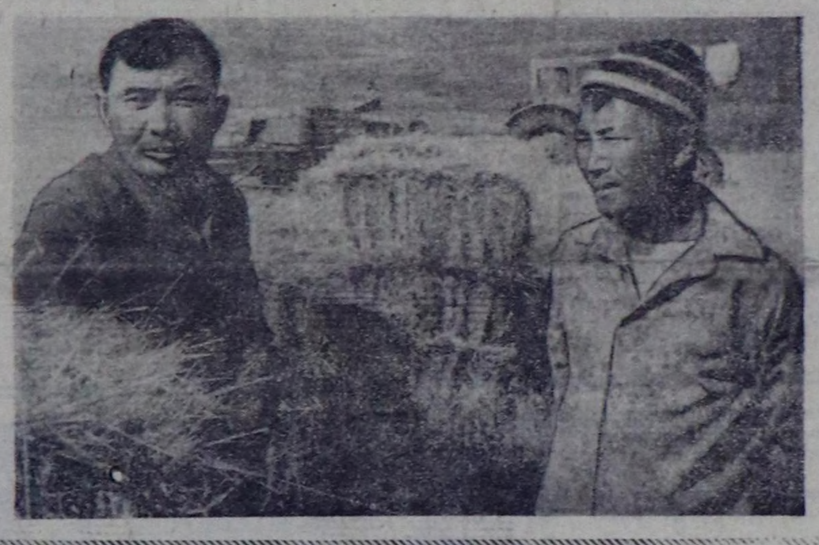
СИГЕННИ САРААТТААР, ТАРААНЫ ШЫГЖАМЫРГА УРАР!