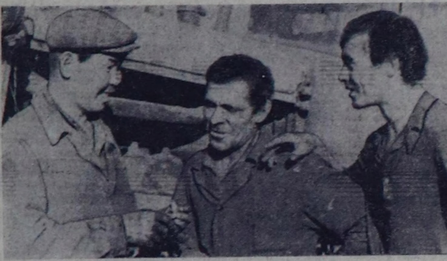
«Улуг Октябрь» совхозтуң механизаторлары күскү чер аңдарылганын белин темпи-биле чорудуп турар. Ажыл-агыйның механизаторлары алган хүлээлгезин чедишкениң күүседир сөрүлгалыг шудургу амылдап турарлар.

Онун чедип алдырынга делегей харызаалаарында калбак орукту тыпкан, сургалып совет-америка документтерде айтылган принциптерин — күрүселерниң тайбын кожа-хелбээ турарынын, өскөлөрүн иштиги херектерин сатыры иреттерин, Бистиң иштиги херектериниңти кыгма-лаа холгаарлатпас бис.