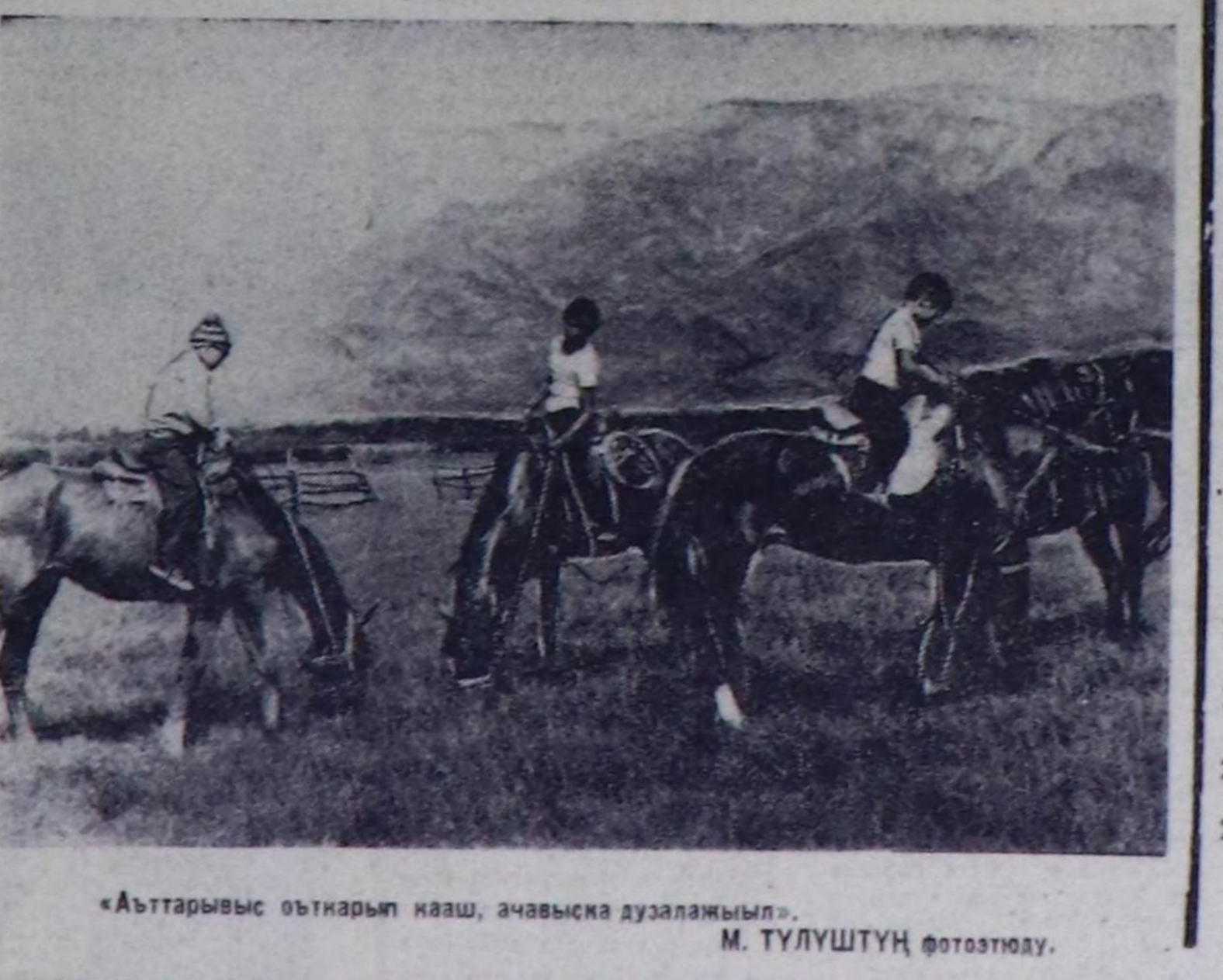
«Абтарывыс оттарып кааш, ачавыска дузаламын».