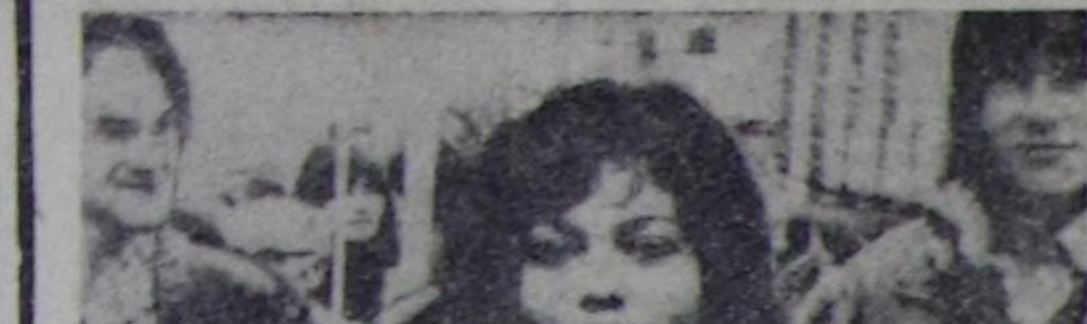
ГДР-ниң депшилтеги амыктары (Чурукта) бөо чепсегити эдере бугурурнине улут чынаалдарга тайбың дээш, дайынның хулавындан хөгүтү аммырал дээш иришип турар.

Даштыкы херектер болгаш камгалал министрлериниң дегенелди чөгөткө чар Вашингтонга добузуган агит-араб-лай-америк журажыкчыны Кэмп-Дэвид дугурулгаларын чар арабтарга улут утулган чөдө катан бадыткаан. (СЭТА).