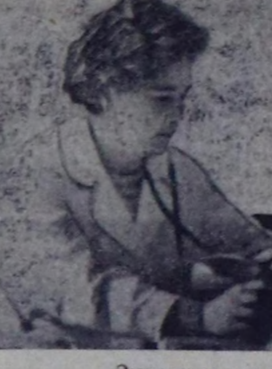
Эмнелгеде хүдээп алышкын

дер, уду-дедир дуаалажырлар — боту-ла найыралдыг өг-бүлө боту бергенер. Клубка кинону хүнүн чыгып барып көрүп, библиотекадан номнары номчуп, солуннары, журналдарын хүн санында ап, радиону дыңдап турарлар. Дөргү-төрөдери-биле чагаалажып, кезеде бажыг харылааны тулуп, ынай-баар адылажып-ла турарлар. Кижиниң амьдыралы черде ынды болган.