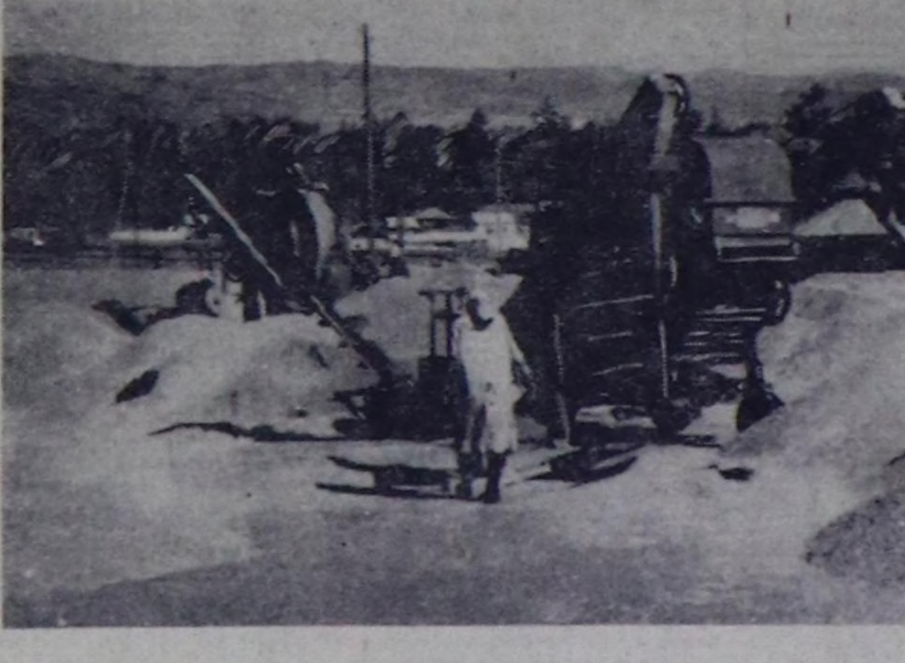
Бөгүн—Арга-ыяш ажилдакчызынын хуну

— Бир-ле дугаарында, тарааны сөөртүп турда төгүлбезин дээш автомашиналарын