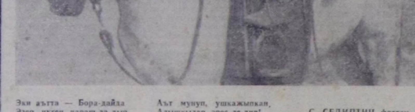
Эки аятта — Бора-дайла Эсер, чүгөн чараш-ла-дыр.

Морзуктуңуң баарыңдан оон өртемчөкө шөгөн үнүң копка орунуга өөрүңү-дөс муңгарал-лаз таварышкылаан Бижиг туршугу коммунист Седип-оол Токпак-оолунун бу- руңгар лор билин, төвөңи инак човунга өгөс чагай үл- дө-херекти кыдырыла өрө- дөлгөн чораш. Эйн херекте- ле ол бодунуң төлөңгө үлү- хүүзү кирилгезин-даа ол Күш-ажыдын Кызыл Тук ор- ден болгаш Ленин кылбай медали-биле боза шондоткон.