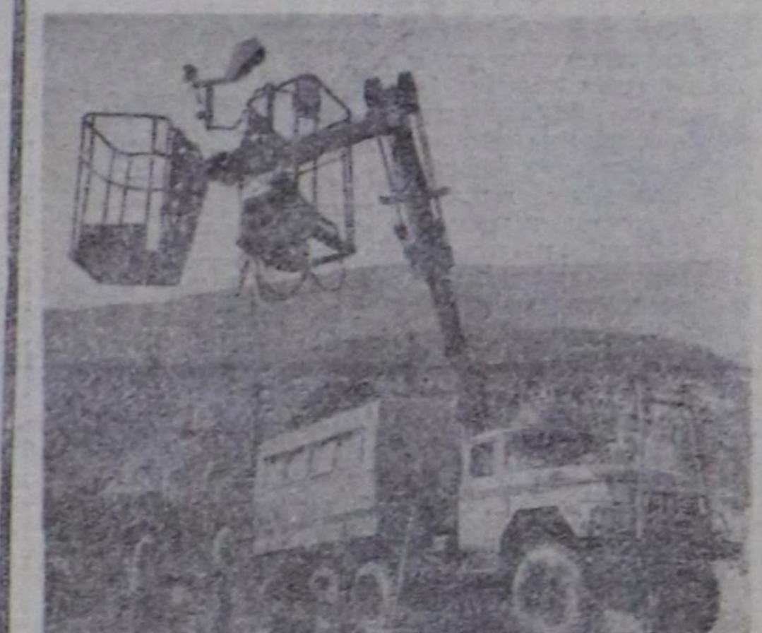
Азербайжан ССР, Бойдус куртанларын космонстан шиччаларынч институту — республиканын ултунер акцентиланын системинде ви анык албан чери...