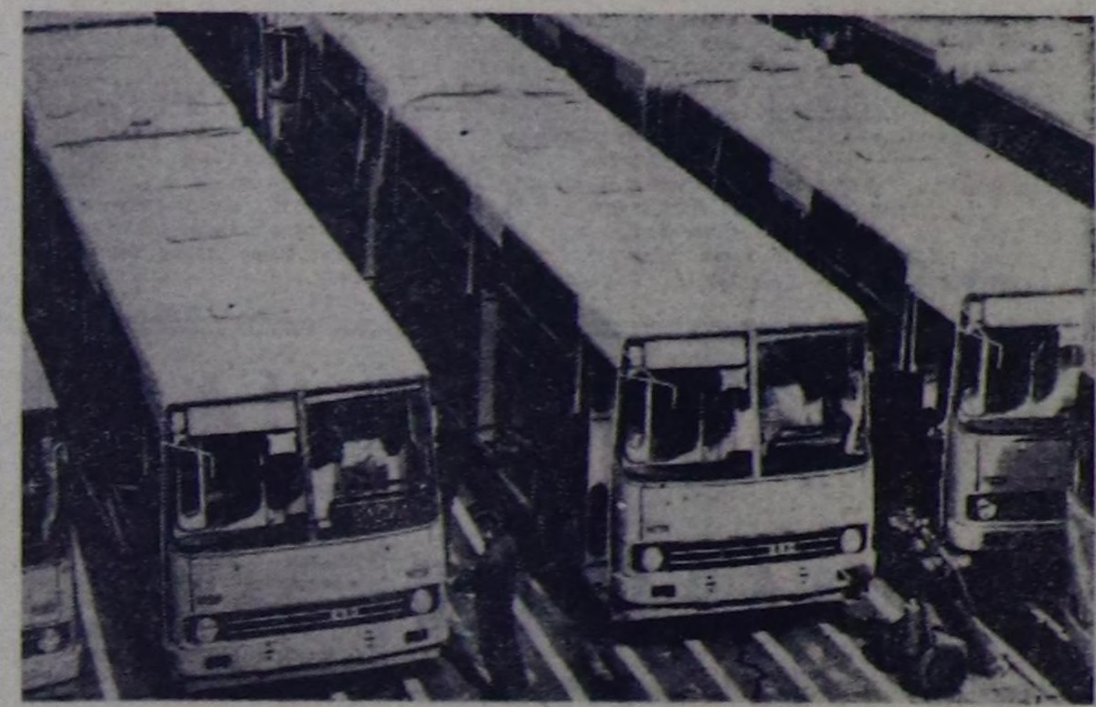
Совет Эвилели бола Венг Улус Республиканын эң чугула экономикагын...