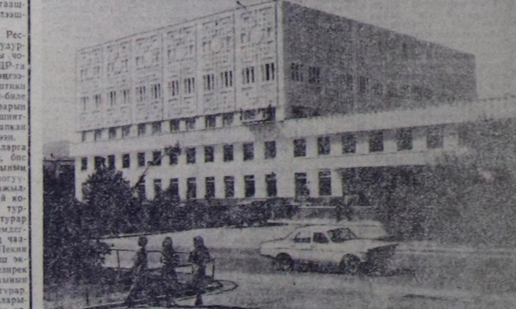
Совет-моол кады ажылдажылга чык келген тулум улам калбарып орад. Совет тулдужуулар, геологтар, башкылар ажаа барып ажылдап турарлар. Ийн чурт аралың экономикаң, културатур харылзаа-лары бажымың, сайынар турар.