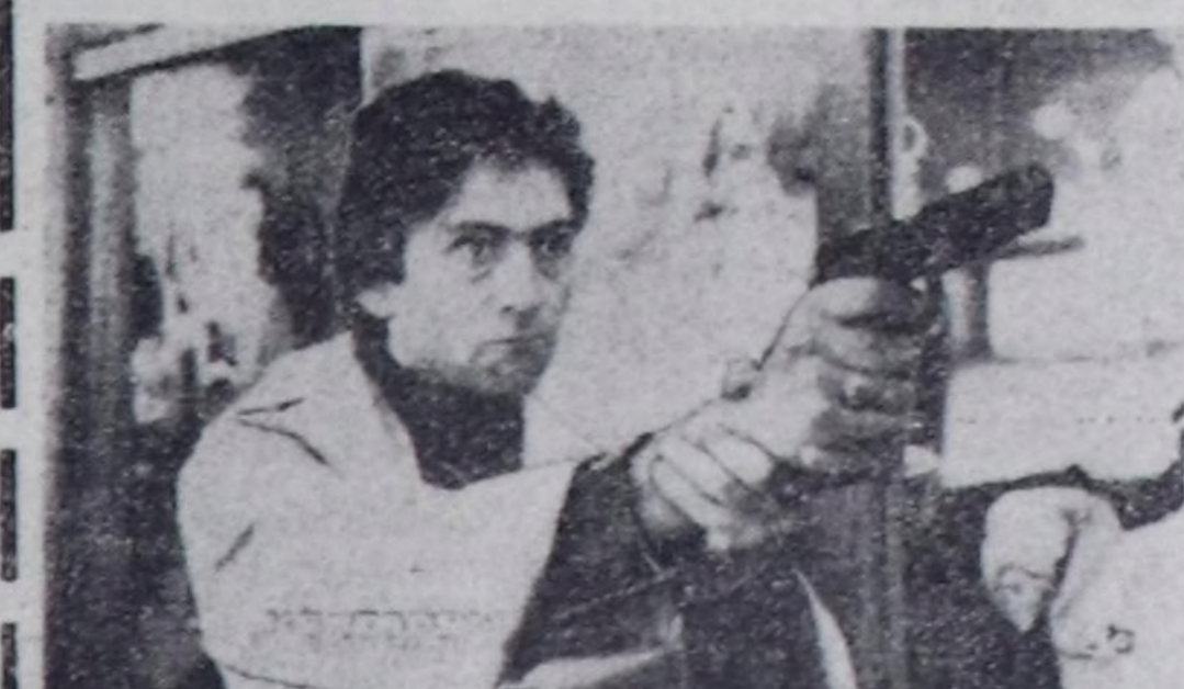
Ук кино республиканын кинокарнарында үнү эгелөөн.

«Мосфильм» киностудия-мын Латия Америкаын бир республиказыга революция-нын кантаар өскүп, көкүп коллегияны дугайында үндү-ргөн кинону «Контарлар» деп адаан. Кыя Чынгө болган ханын бодушкуну дуга-ымда дөрт чугаалайы-даа турга, а херек кырында ову кортуган турар. Алсвендия удуругулаан-биле эрес-дидим, туртуштү революциялар а-т-сым документалер Буа-гар алаткымын турар-лаа болза, херек кырында олар-нын шыдымаккай мадырамы