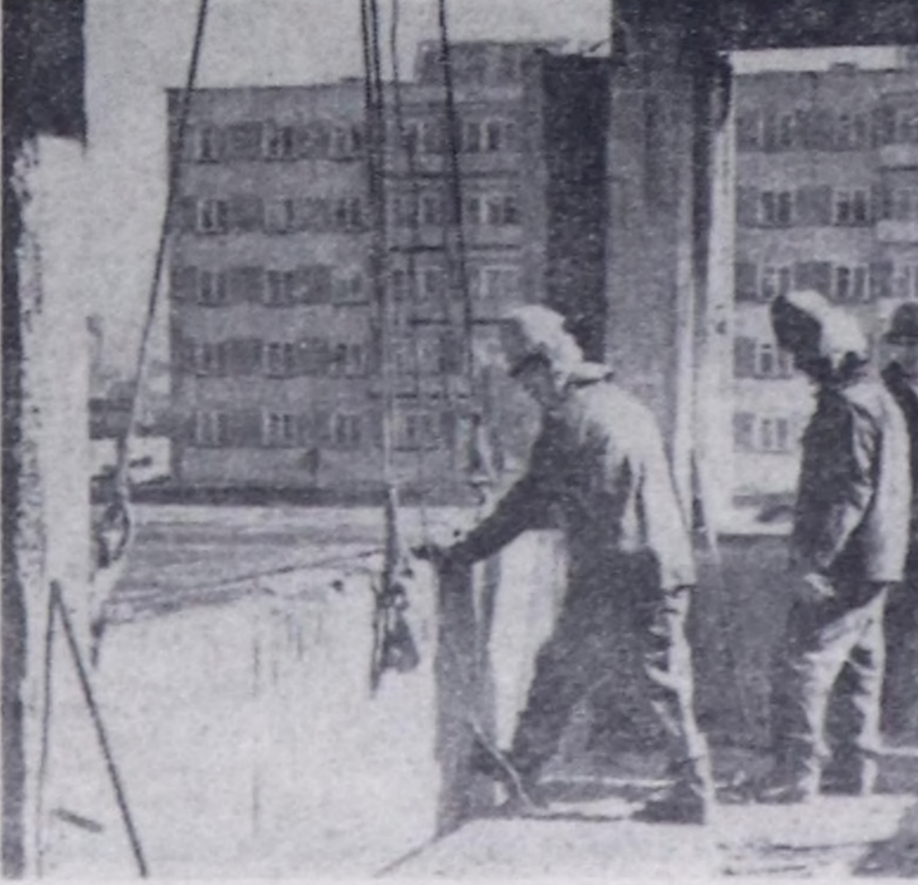
Турганмыс ижиң каттан мрак эвесе чаа эгелден наан тудуу көстү турар.