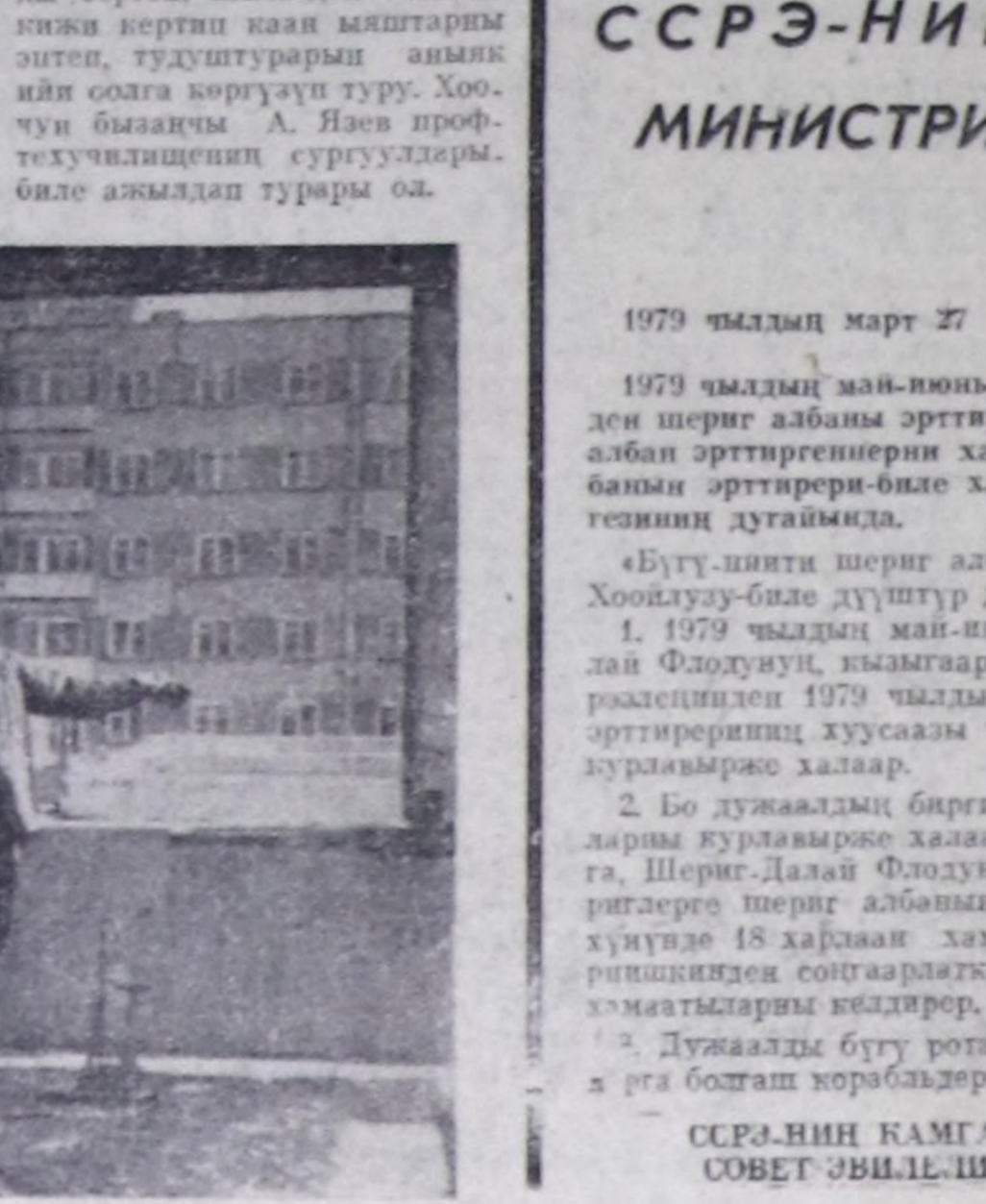
Турганмыс ижиң каттан мрак эвесе чаа эгелден наан тудуу көстү турар.