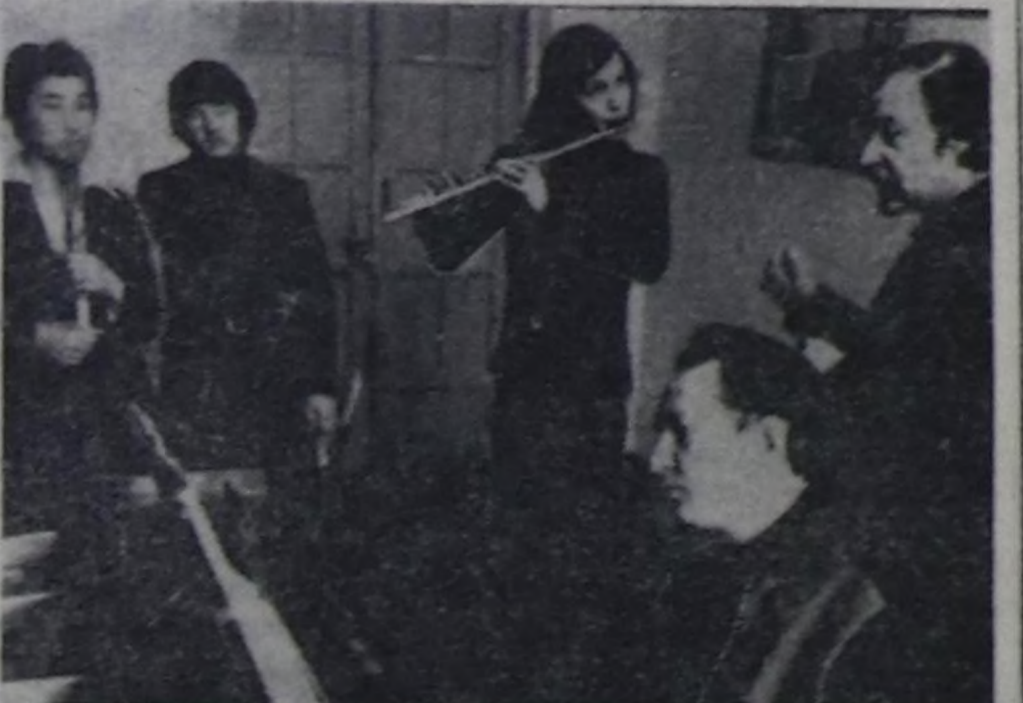
Кызылдың уран чүүү училищези республикада культура-чырыдышкын албан черлериниң ажилдакчыларын, чурукчуларын болгаш музыканттарын белеткээриниң ёзулу төвү апарган. Ону чыдыр тускай эртемчилер доозуп үгөн. Бо чылым оң бугу, салбырларында үш чус бежен кижил өөренип турар. Училище бир чыл болгаш бодунуң тургустунганында бээр чээрби чылын демделээр.