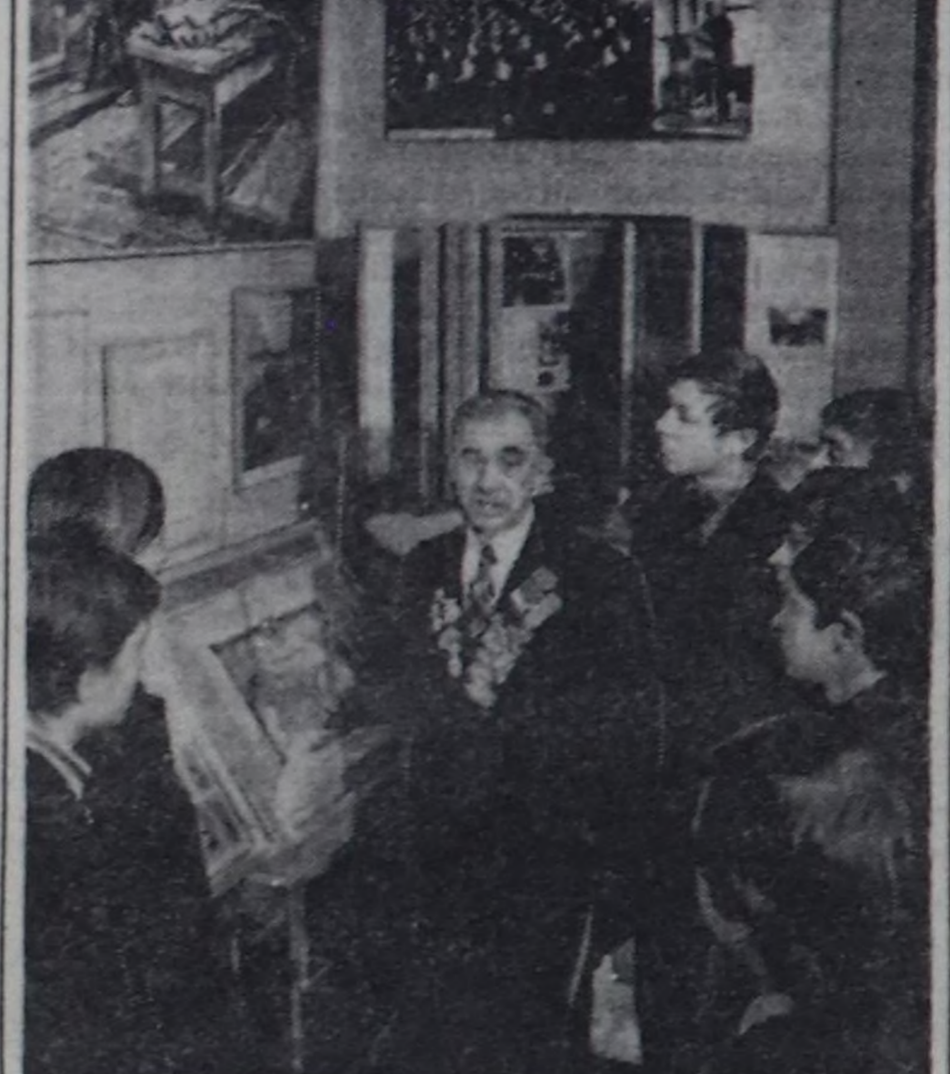
ЛЕНИНГРАД. Бистик чуртувуса социалисттик нерзалерин бүдүрүлгөриң болгаш тус-тус ажалчыларын аразына чарып эгелээндөн бээр 50 чыл болган оюн СССР-ниң бүгү черлеринге эрткин айда демдегел эрткирген. Ол патриотик шимчээшкни чурттуң экономиказының бүгү адырларын көжүдөргө магалыг чагаай салдары чедирген. Социалисттик көрө өзүгээр ажалдар деп эгелээшкни кезинде барып күш-ажылыды коммунисттик өзү-биле көөр деп массалыг шимчээшкни чедирген.

Бо шимчээшкни эң баштап Ленинград хоорайның улуту бүдүрүлгөриңден эңептер эгелээп. Революцияның кавайы хоорайның «Красный выборже» каттыжышкынының хөй санны коллективтер эгелээшкниң бөжөн чыл оюн таварыштыр анык ажалчыларын ортузунга ол дугайында та-ийлыр ажалын калба-биле чоруткан.