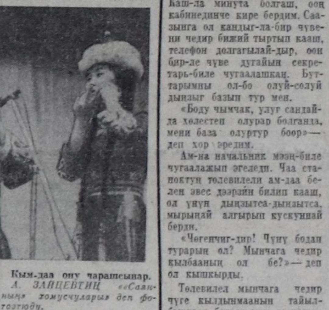
Хомусу үнү таалаңчыг, Хоор чонум дийлэн ханмас. Кыңгырт кылдыр ойноп берээл.