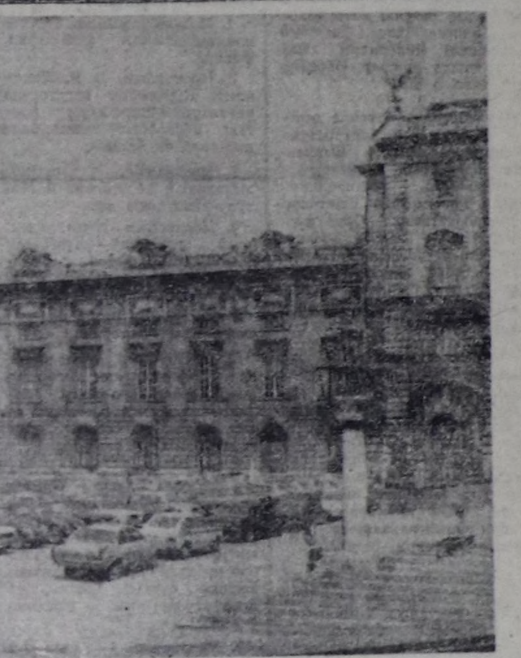
Австриянын найысылалы Вена болза Европаның улуг хоорайларының бирээзи болур. Ында чурттуу эң чутула чаан ал- бан черлери, өөрөдөлгө черлери, культура топу, үлетпүр бұдургаларынын хой незин туруу турар. Венаның архитектура болгаш төөгү ту- раскаалары оон делегейин эң чараш хоорайларынын бирээзи болдурулган.