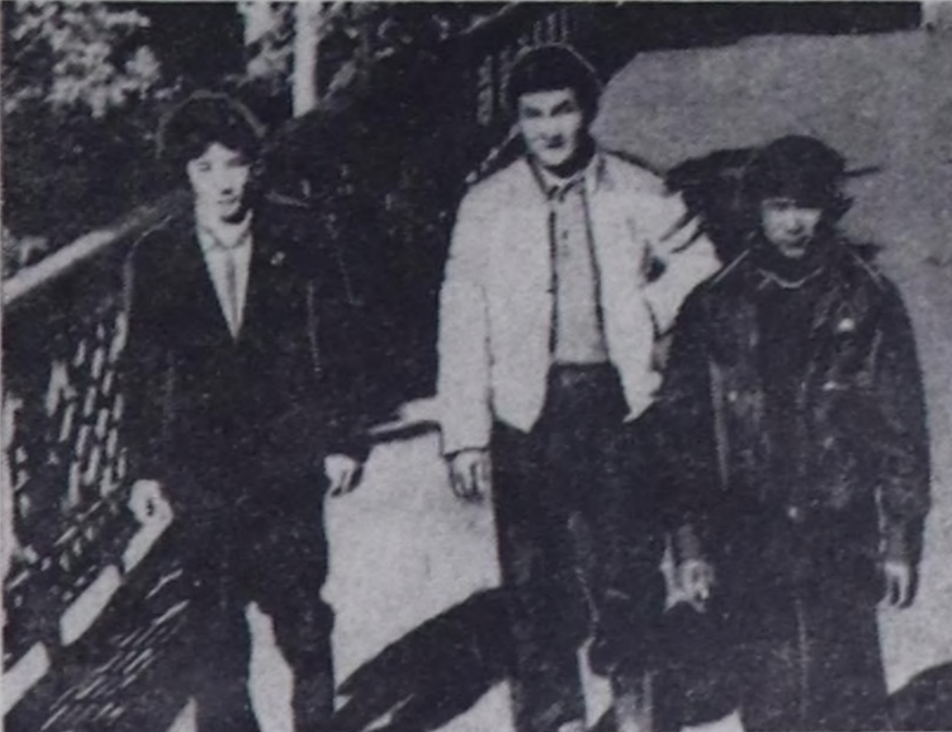
Кызылда тураскаал чамында биче чаптар.

Хүрежин келген үп мөгелериниң эң-не аныяа 18 харлыг Одрог Балажынин 82 кг-га хүрежир.