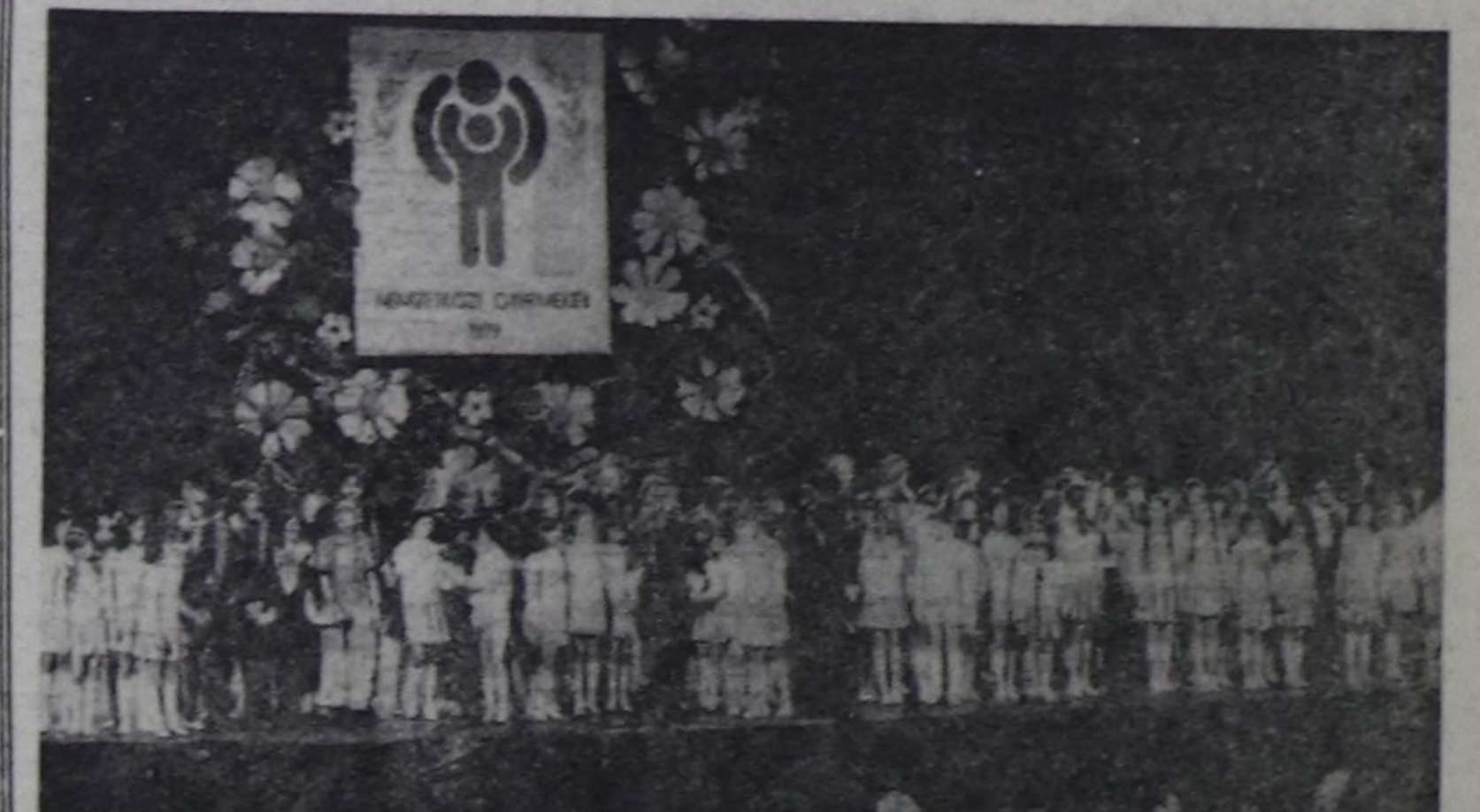
БУДАПЕШТ. Венг наймысалга Уругларның делегей чылына тураскаан байлыгы кезеке болган. Күрүнө операцияны филиалының бажымчы болган көп-көптөн чыгынган ажи-херектиги КНО-нуң Уруглар фондуунга дамчып берген.

Уруглар камгалалының делегей хүнү бо чытып оңа байлаа эртин турар: 1979 чылы Каттышкан Нащиялар Организациясы Делегейиң уруглар чылы кылдыр чарлаан. 20 чыл мурунда КНО «Уруглар эргелериниң декларациязын» чогадып тургусканы, хүдөп алган. Ону баугар бүгү дилтериниң уруглары кежиниң өңүндө, каныг дымда чугалап турарында амаарыга чокча аас-кежиктиг болуп чурттар эргелиг, а кизи төрөгөтү бодунда бар бүгү-ле эки чүүдөрдүн ажи-төлгө бээр дү-дөдөлгө.