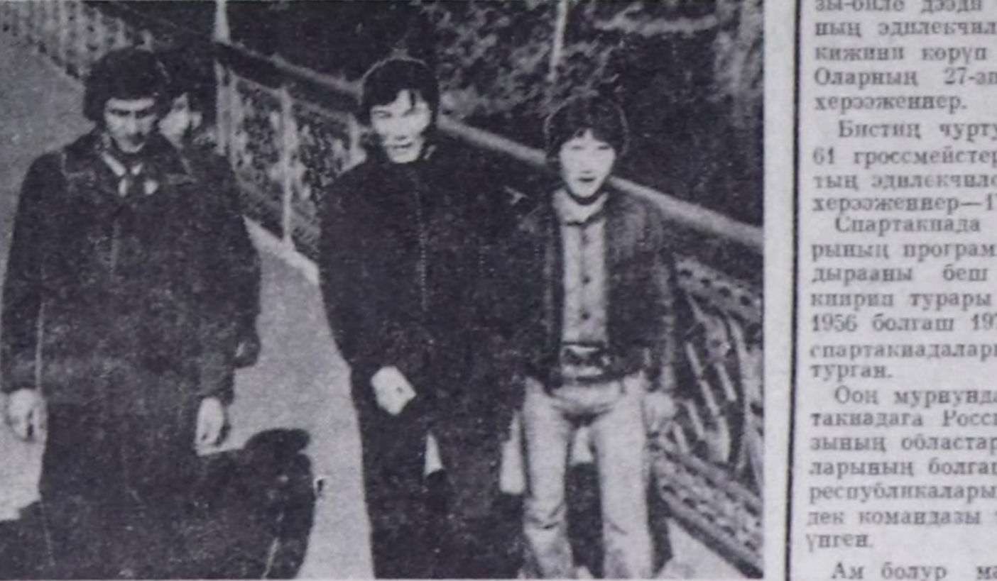
Кызылда тураскаал чамында биче чаптар.