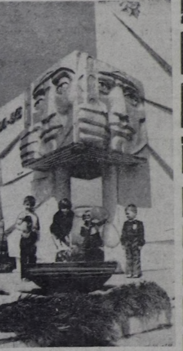
ЧУРУКТА: Кызылда тураскаал чамында биче чаптар.