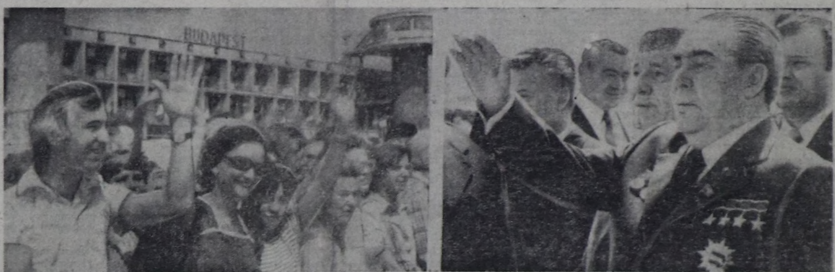
СЭКП ТК-нын Чингине секретары, ССРЭ-ниң Дээди Совединиң Президиумунуң Даргазы Л. И. Брежнев баштадыр совет партия-чазак делегациязы май 30-де Москвадан Будапештиде чөдө берген. ЧУРУКТА: аэропортка уткуушкун үезинде.