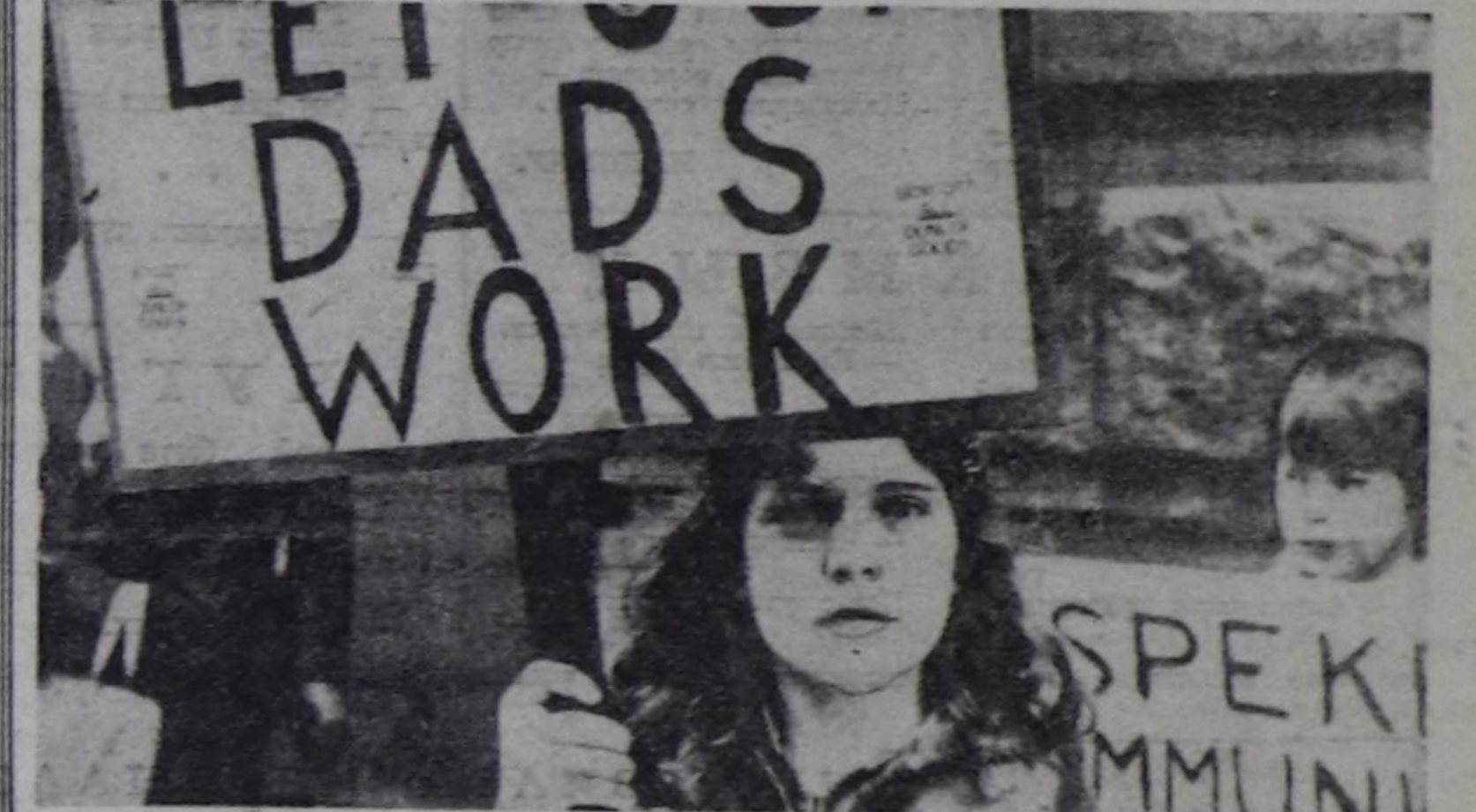
Англи ажилчынарның бо бичин уруглары ади-пелериниң ажилдар эрген дээр эрге демисел агай бергендер. Боттарының үе-чегелери-биле ойнаарының орунуга, олар ади-пелери-биле кал-дөргө ажи береп, чымылга үнүп келгенер. «Бистик адалымыска ажилдан берире!» — деп чаш англи уругларның лозуну кылган болган.

НЬЮ-ЙОРК. (СЭТА). Египет президент Садат Ибраһимдин мурунга долу дүжүн бер-ришиниң дорамчылаадыг чаа баамчырып кылган деп, ЕАР-ның баштынының Бегини-биле Эль-Аришке болгаш Беер-Шевеге чоруткан чугала-лажымшкынның түндөлдө-ринге амаарыштыр ол черин политиктик бөлүктөрү үлөп көргөндөр. Египеттик тускай догуннап чорун салдыгларын үргүлчү-лөшкөн, чагыс талаалыг келерде көрдүнгөн хуусаан мурун Ибраһим-биле кызыл-гаары ажидагында ол чөп-шөрөшкөн. Египеттик даштык херектер министрствонун аспертер удурулун түрбүжө, Бегиниң ыдыг чаш-палаакшынын кымыканын паралага конференцияда Садат билинген. Тель-Авив биле Каириниң аразында агаар харылзааны албан бауу-биле азыткан. Садат болгаш Бегин аекте-даа дугурулгаларын чарган, ычтанга-даа тактиктиг бодал-дар ужурунда оңу олар ам-дызында чажырып туралар деп, «Нью-Йорк дейли Ньюс» солунун корреспондентизи демдегелен. БАГДА. (СЭТА). Иракия-биле кызылгаары деп-дөраан