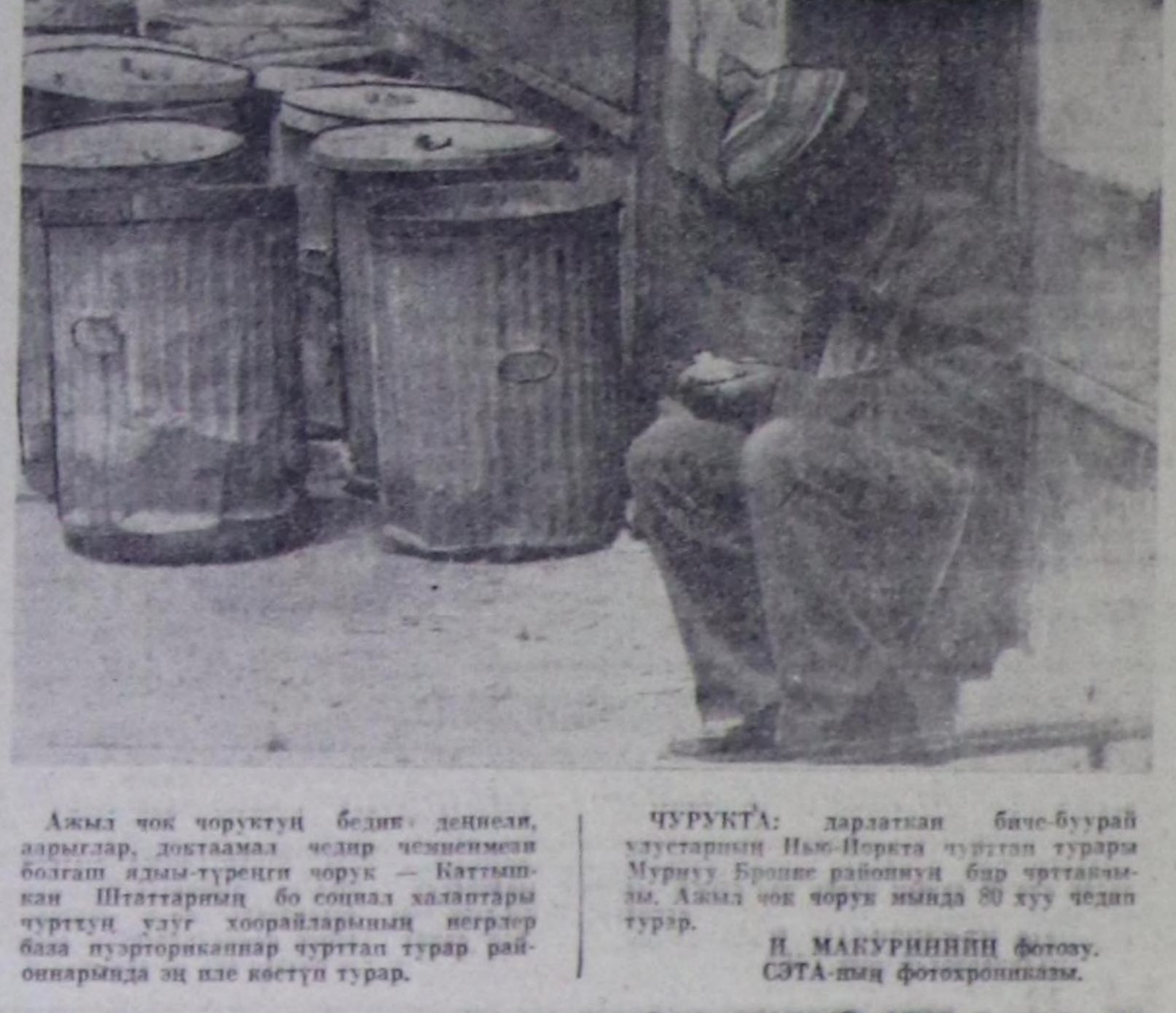
Ажык чок чорутуу бедни; деннеи, аарыгар, доктаамал чедир чөсөмөш болган иди-туренин чорук — Каттык-кан Штаттарыны бо социал халаларты чурттуу улуг хоорайларынын негрлер база эртерорканын чурттап турар рай-ондарында эң эле көстүп турар. ЧУРУКТА: дарзаткан биче-буурай хуздөдөрүн Нью-Йоркта чурттап турар Мурнуу Бронкс районунн бир чурттан-ны. Ажык чок чорук мында 80 хуу чедип турар.