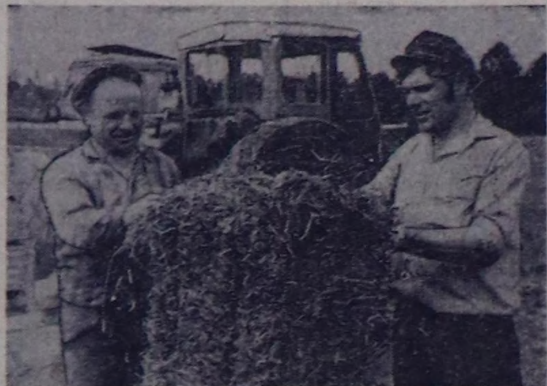
Тандыда «Революцияның чалбыжы» совхозта септиңи кестирген теминиң улам күсүткен. Эрткен чылдарында гектарларга, бо чылы септиңиң үегини өк. Ыңчангаш гектар бүрүздөн 20—22 центнер септиңи кезип, пресстеп турар.