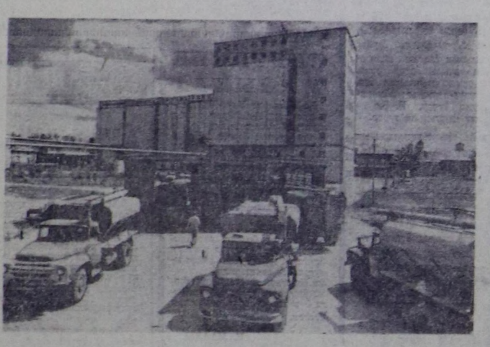
МОСКВА ОБЛАСТЬ. Болшевский комбинор заводу чыл эгезинен бээр кызыл акар 233 муу рубльди белик шинариле продукцияны салым саарган. Бүдүрүгө 50 ажалды кезирип, күшпө, майыстыга болза маалга, тоолууларга, балыктарга комбинорларын бүдүрүп турар. Болшевскийн заводу болза комбинори үдүртүрүп баштагы заводу. Ону В. П. Лениннин инициативага биле чурта эл баштай үндөштөнгөн «Лесные Поляны» совхозтун мал чепи белеткээр.